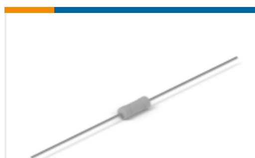
TE 产品编号9-1676123-2 1/2W SM M/OX 5% 5K1