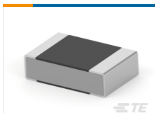
TE 产品编号5-2176271-6 RU 0805 1K0 0.01% 2PPM 1K RL