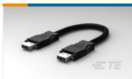
TE 产品编号2083112-4 CABLE ASSY IND. USB-IND. USB TYPE A