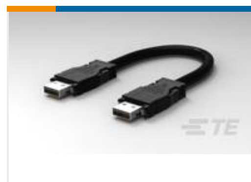
TE 产品编号2083112-3 CABLE ASSY IND. USB-IND. USB TYPE A