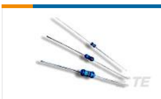
TE 产品编号1622684-1 LR2 1% 130K