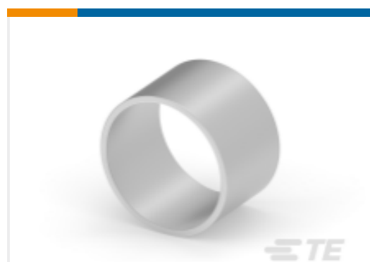
TE 产品编号2-2308350-1 CRIMP BARREL11