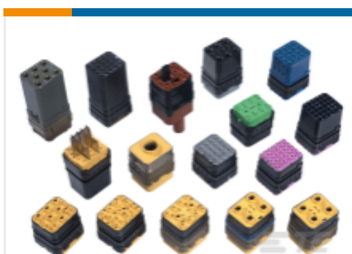
TE 产品编号ZPF000000000015268 DMC-M 12-20 PN