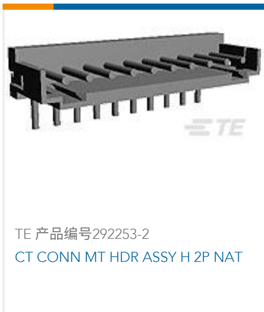
TE 产品编号292253-2 CT CONN MT HDR ASSY H 2P NAT