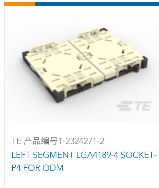
TE 产品编号1-2324271-2 LEFT SEGMENT LGA4189-4 SOCKET-P4 FOR ODM