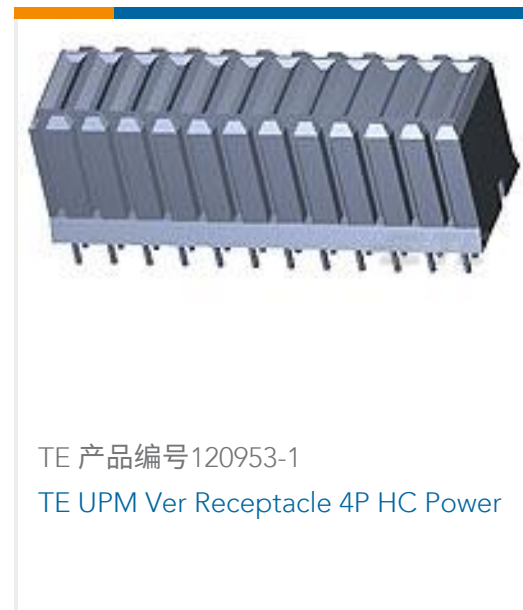
TE 产品编号120953-1 TE UPM Ver Receptacle 4P HC Power