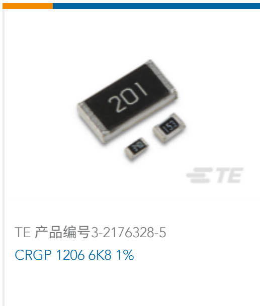
TE 产品编号3-2176328-5 CRGP 1206 6K8 1%