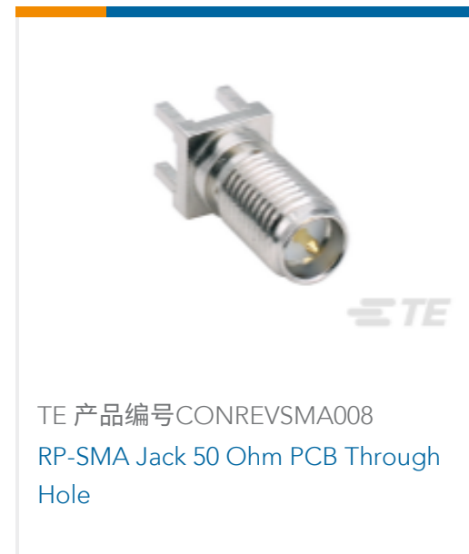
TE 产品编号CONREVSMA008 RP-SMA Jack 50 Ohm PCB Through Hole