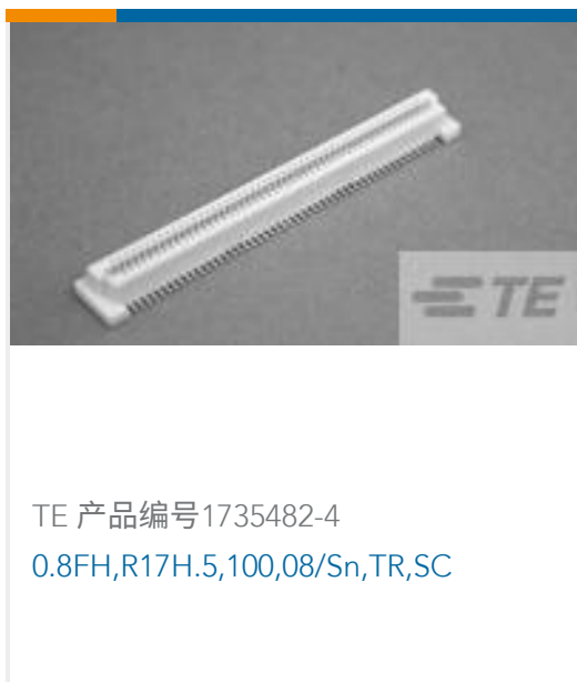
TE 产品编号1735482-4 0.8FH,R17H.5,100,08/Sn,TR,SC