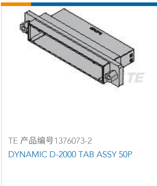
TE 产品编号1376073-2 DYNAMIC D-2000 TAB ASSY 50P