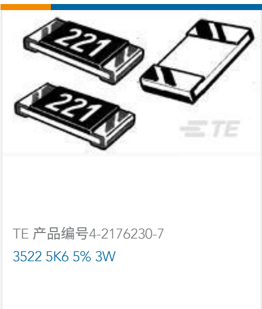
TE 产品编号4-2176230-7 3522 5K6 5% 3W