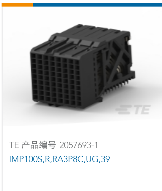
TE 产品编号 2057693-1 IMP100S,R,RA3P8C,UG,39