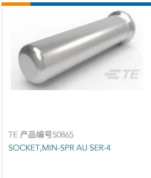
TE 产品编号50865 SOCKET,MIN-SPR AU SER-4