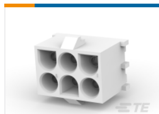
TE 产品编号2029451-1 06P UMNL SOK HDR ASSY W/O DRNS