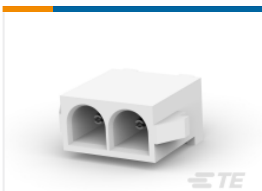
TE 产品编号1586076-1 02P UMNL PIN HDR W/O DRNS V2