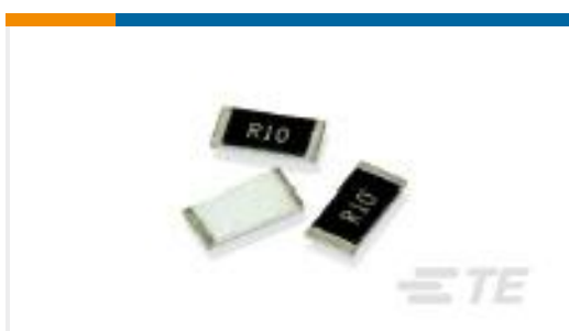
TE 产品编号4-1622825-6 RL73K 3A R27 5% 4K RL