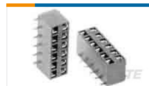
TE 产品编号2-969973-0 2x20P HV100 REC. CON, SMD, GOLD, BLISTER