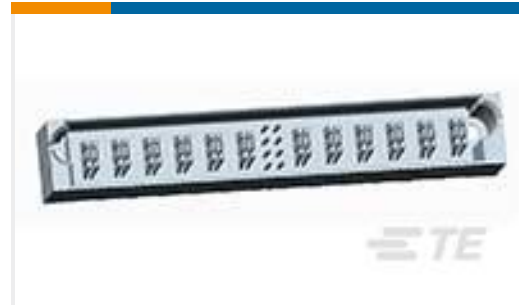
TE 产品编号6450820-9 XLE V/H 8P + 72S + 8P W/VENT HOLE