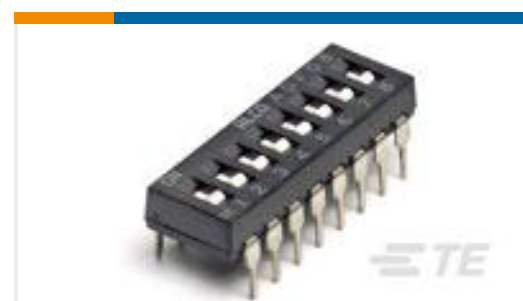
TE 产品编号1-1825002-7 ADF1004=DIP SWT,FLUSH,THRU/HL