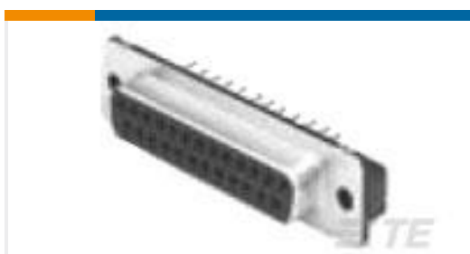
TE 产品编号3-338313-2 9P.HDP20 REC. ASSY