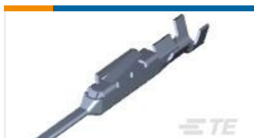
TE 产品编号1318112-1 DYNAMIC D-2 TAB CONT S L/P