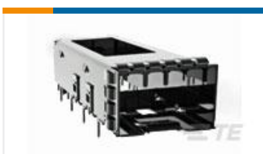
TE 产品编号2007198-2 SFP+ 1x1 Cage Assembly, Press-Fit