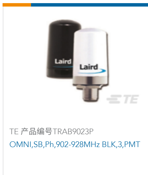
TE 产品编号TRAB9023P OMNI,SB,Ph,902-928MHz BLK,3,PMT