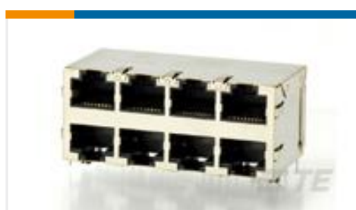
TE 产品编号1-5569262-1 STK MJ ASSY,8POS,2X4,SHLD,CATS