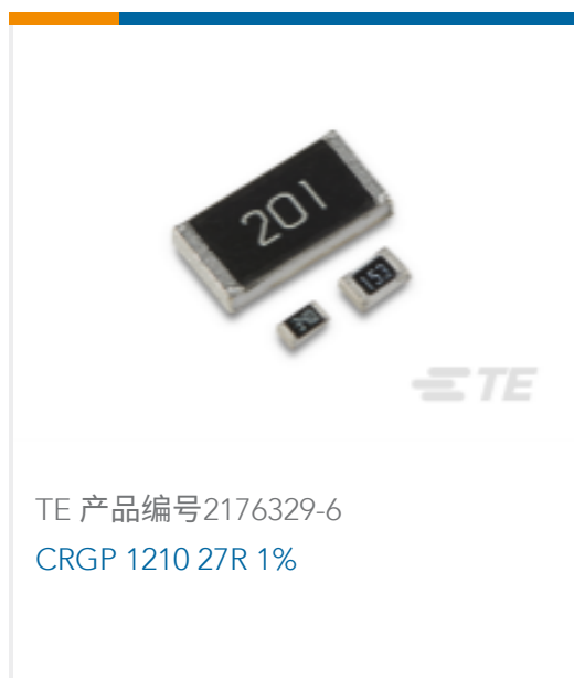
TE 产品编号2176329-6 CRGP 1210 27R 1%