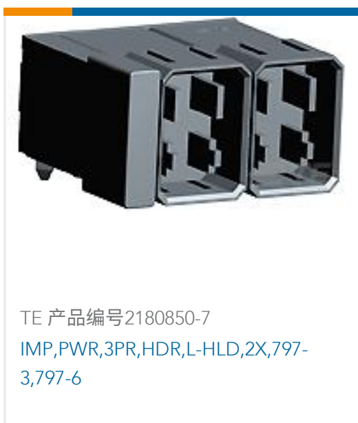
TE 产品编号2180850-7 IMP,PWR,3PR,HDR,L-HLD,2X,797-3,797-6