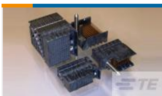
TE 产品编号 2057764-2 IMP100S,H,V3P8C,UG,OEW39,4.9