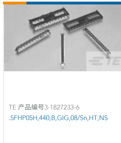
TE 产品编号3-1827233-6 .5FHP05H,440,B,GIG,08/Sn,HT,NS