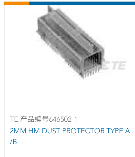
TE 产品编号646502-1 2MM HM DUST PROTECTOR TYPE A /B