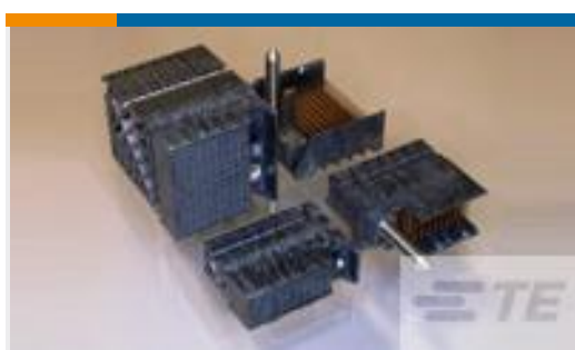
TE 产品编号 2057417-1 IMP100S,R,RA4P8C,UG,39