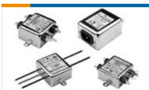
TE 产品编号2-6609028-0 30VK6=F7358 S0