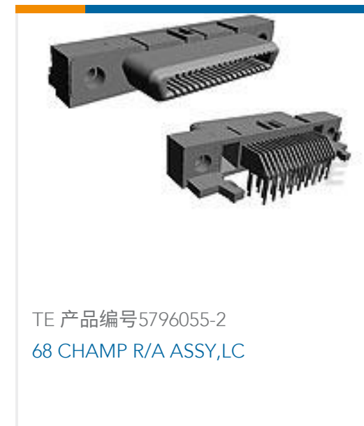
TE 产品编号5796055-2 68 CHAMP R/A ASSY,LC