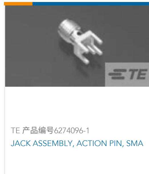
TE 产品编号6274096-1 JACK ASSEMBLY, ACTION PIN, SMA