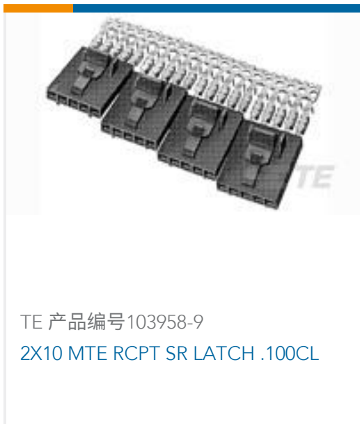
TE 产品编号103958-9 2X10 MTE RCPT SR LATCH .100CL