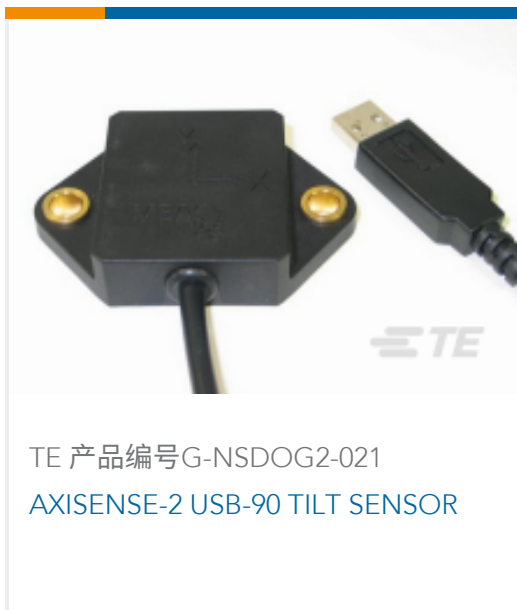
TE 产品编号G-NSDOG2-021 AXISENSE-2 USB-90 TILT SENSOR