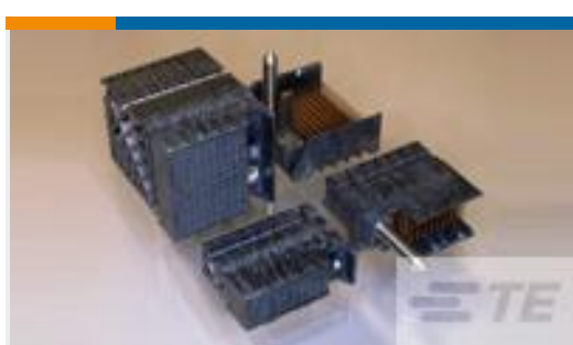
TE 产品编号 2057405-1 IMP100S,R,RA2P10C,UG,39