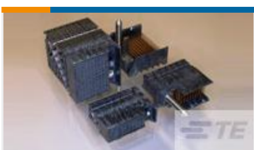
TE 产品编号 2057448-1 IMP100S,H,V4P8C,UG,DEW39,4.5