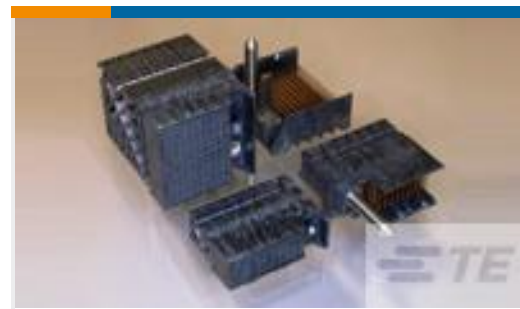
TE 产品编号 2057443-2 IMP100S,H,V4P8C,UG,LEW46,4.9