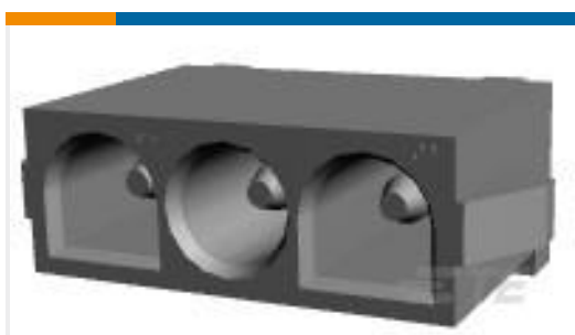
TE 产品编号350429-1 03P UMNL PIN HDR ASSY NATL