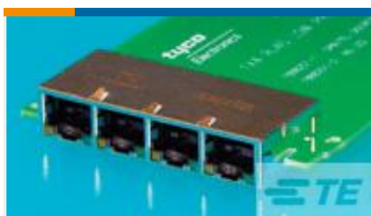
TE 产品编号1888251-2 Low Profile,RJ45,1x4,Bi-Color