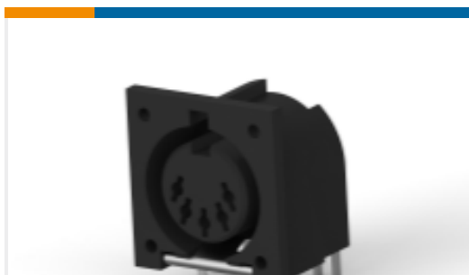
TE 产品编号5211450-1 5 CIRC DIN RCPT GRND CLIP