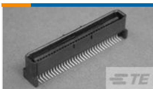
TE 产品编号5120527-1 1FHP,64,30A/S,S,N,S10,12,13,15