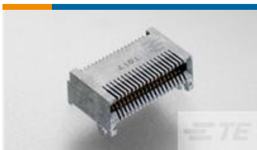
TE 产品编号2110819-1 QSFP+ Enh EVERCLEAR PT Conn