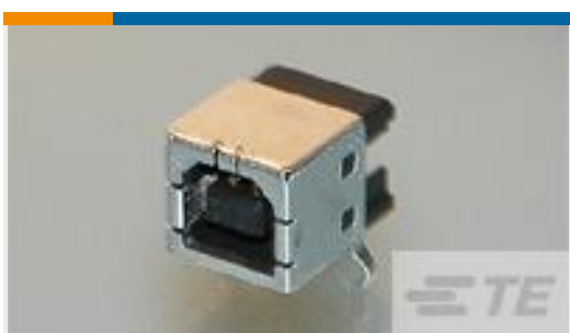
TE 产品编号292304-1 STD USB TYPE B, R/A, T/H