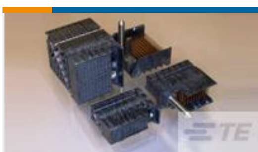
TE 产品编号 2057448-2 IMP100S,H,V4P8C,UG,DEW39,4.9