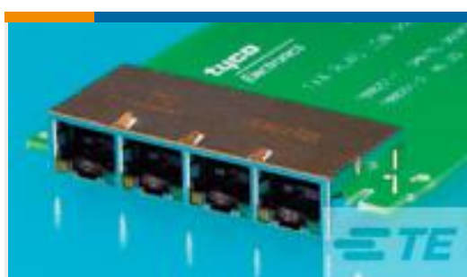
TE 产品编号1888251-1 Low Profile,RJ45,1x4,GRN/YEL