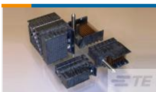
TE 产品编号2007705-1 IMP100S,R,RA3P10C,UG,39