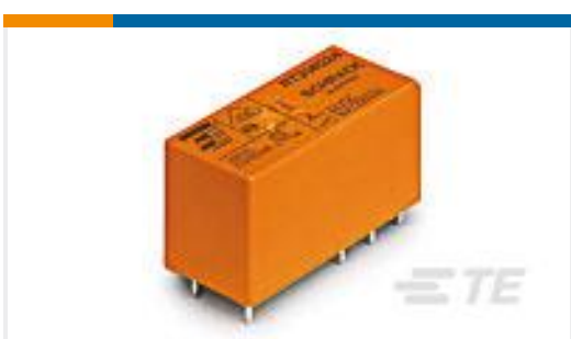
TE 产品编号1-1393239-8 RT114615