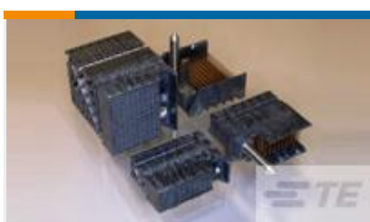
TE 产品编号 2057748-1 IMP100S,H,V2P16C,UG,OEWS39,4,5