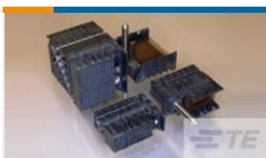
TE 产品编号2057402-1 IMP100S,R,RA2P10C,UG,46