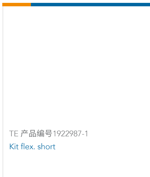
TE 产品编号1922987-1 Kit flex. short