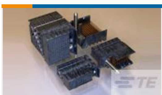
TE 产品编号2180613-1 IMP100,S,H,RA2P10C,LG,OEW39SL