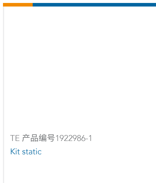
TE 产品编号1922986-1 Kit static