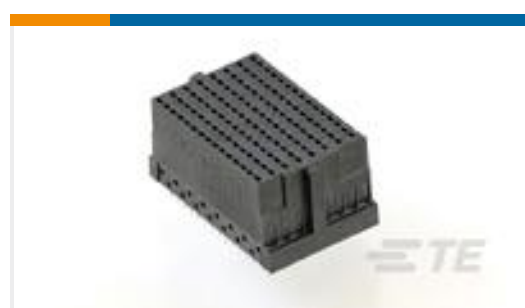
TE 产品编号1934949-1 Tinman 5pr 8col vert recpt 15mm stack