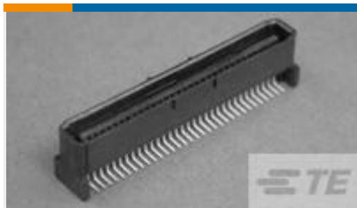
TE 产品编号5146888-1 1FHP,64,30A/S,S,C,S10,12,13,15