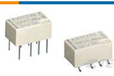
TE 产品编号1462037-1 IM01GR=IM RELAY 140mW 3V