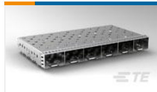
TE 产品编号2007251-1 SFP+ 1x6 Cage Assembly