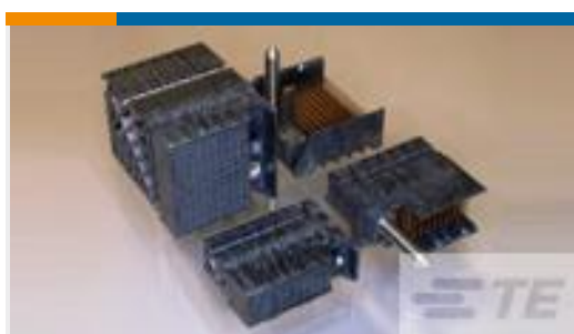
TE 产品编号 2057430-1 IMP100S,H,V2P10C,UG,OEW39,4,5