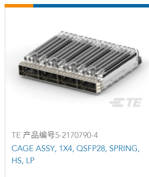
TE 产品编号5-2170790-4 CAGE ASSY, 1X4, QSFP28, SPRING, HS, LP