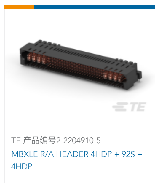
TE 产品编号2-2204910-5 MBXLE R/A HEADER 4HDP + 92S + 4HDP