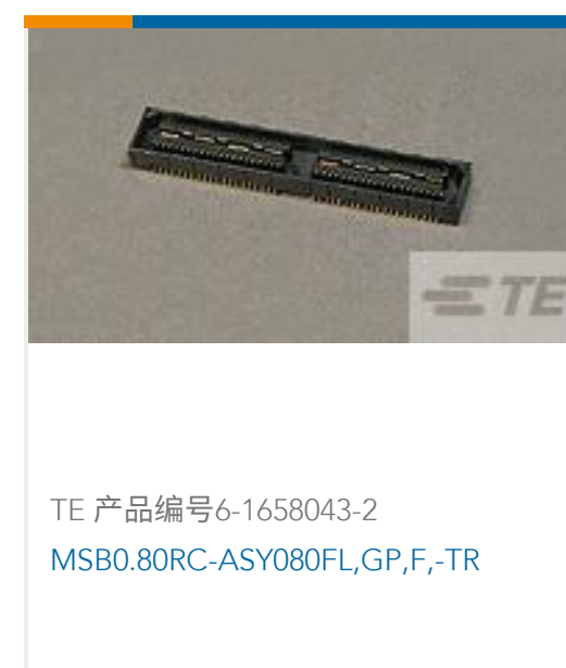
TE 产品编号6-1658043-2 MSB0.80RC-ASY080FL,GP,F,-TR