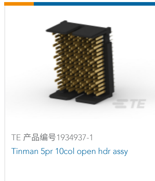
TE 产品编号1934937-1 Tinman 5pr 10col open hdr assy