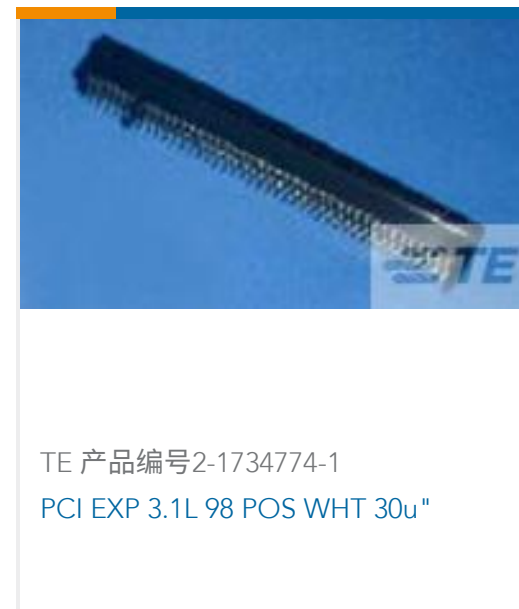
TE 产品编号2-1734774-1 PCI EXP 3.1L 98 POS WHT 30u"