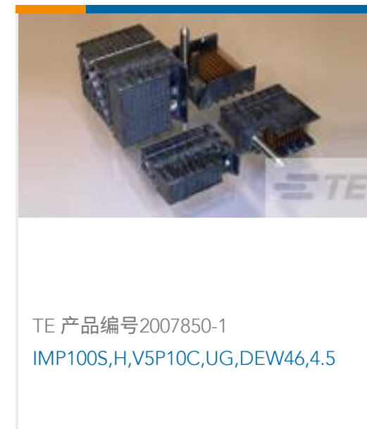
TE 产品编号2007850-1 IMP100S,H,V5P10C,UG,DEW46,4,5