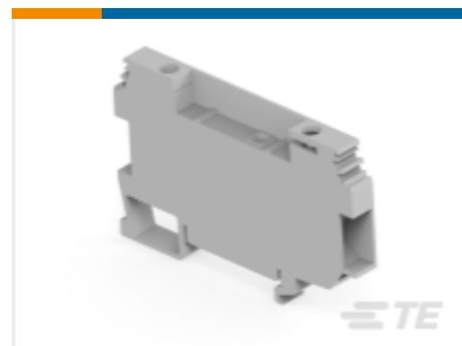
TE 产品编号1SNA115914R0700 D6/8.ST.RS