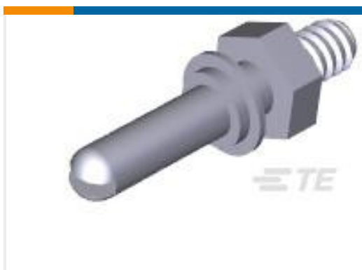
TE 产品编号1-201046-2 SERIES "M" MIN RECT GUIDE PIN