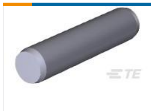
TE 产品编号201501-1 SPIROL PIN