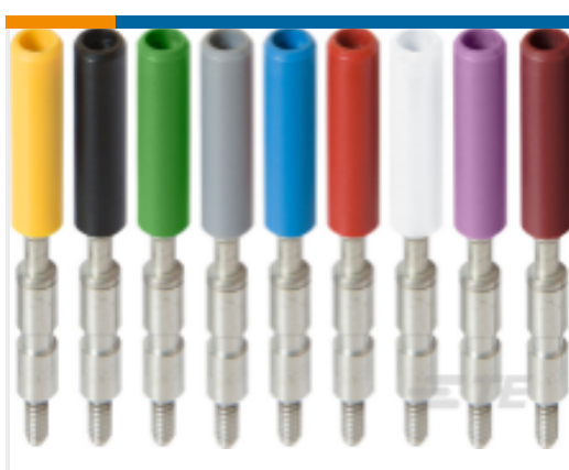
TE 产品编号1SNA179726R0200 AJS9