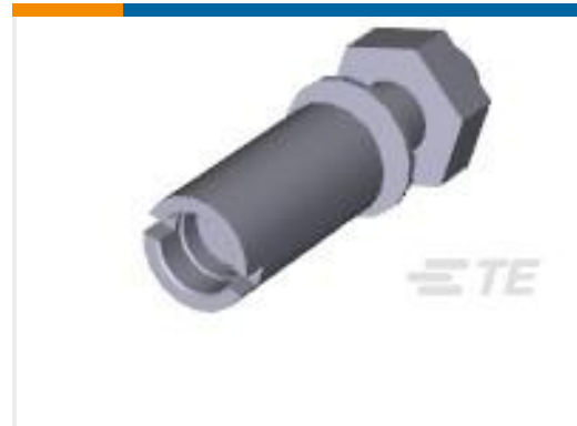
TE 产品编号201047-2 SERIES "M" ST. STL. GUIDE SOC.