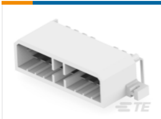
TE 产品编号171366-1 17P HOR CAP HSG WIRE TO PCB