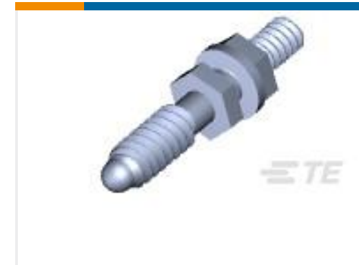
TE 产品编号1-200874-2 SERIES "M" JACKSCREW STUD ASSY