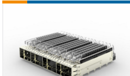
TE 产品编号2170790-3 CAGE ASSY, 1X4, QSFP28, SPRING, HS, LP