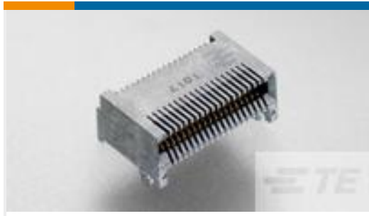
TE 产品编号2110819-1 QSFP+ Enh EVERCLEAR PT Conn