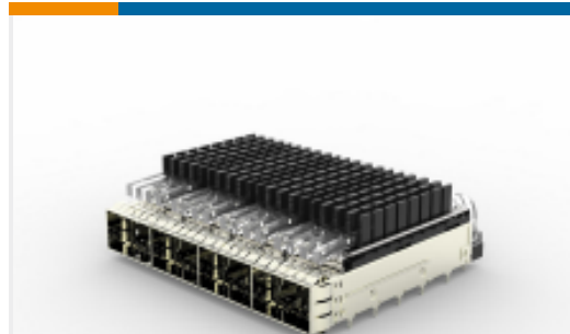
TE 产品编号2170790-2 CAGE ASSY, 1X4, QSFP28, SPRING, HS, LP