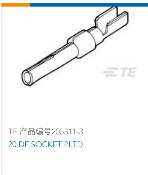
TE 产品编号205311-3 20 DF SOCKET PLTD