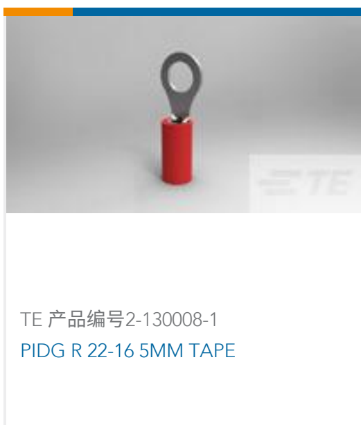
TE 产品编号2-130008-1 PIDG R 22-16 5MM TAPE