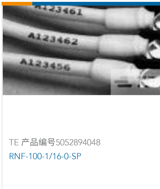
TE 产品编号5052894048 RNF-100-1/16-0-SP