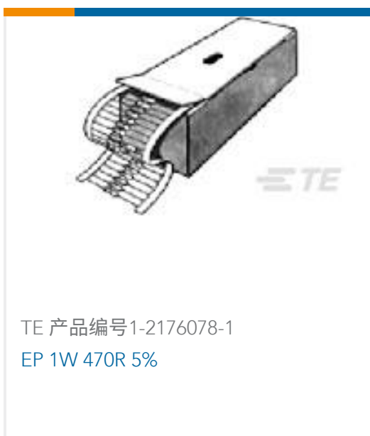
TE 产品编号1-2176078-1 EP 1W 470R 5%