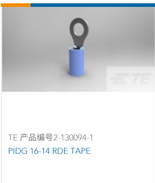
TE 产品编号2-130094-1 PIDG 16-14 RDE TAPE