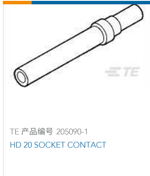
TE 产品编号 205090-1 HD 20 SOCKET CONTACT