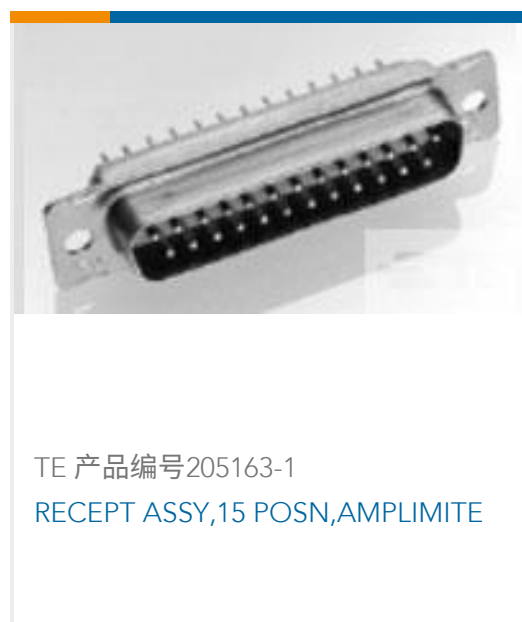
TE 产品编号205163-1 RECEPT ASSY,15 POSN,AMPLIMITE