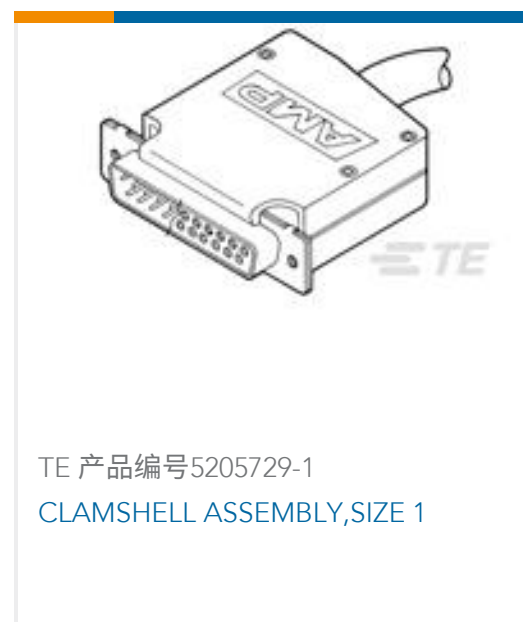
TE 产品编号5205729-1 CLAMSHELL ASSEMBLY,SIZE 1