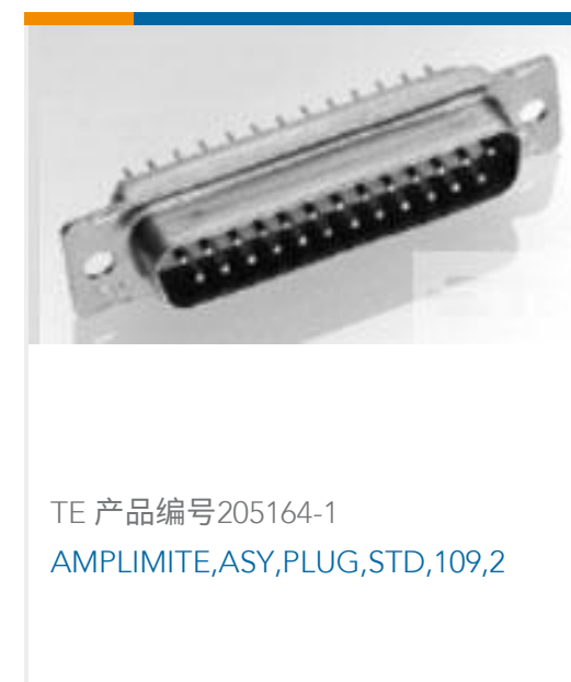
TE 产品编号205164-1 AMPLIMITE,ASY,PLUG,STD,109,2