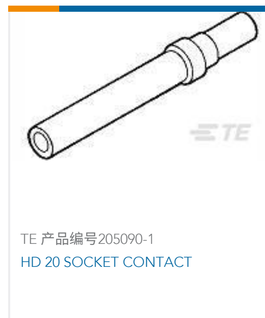
TE 产品编号205090-1 HD 20 SOCKET CONTACT