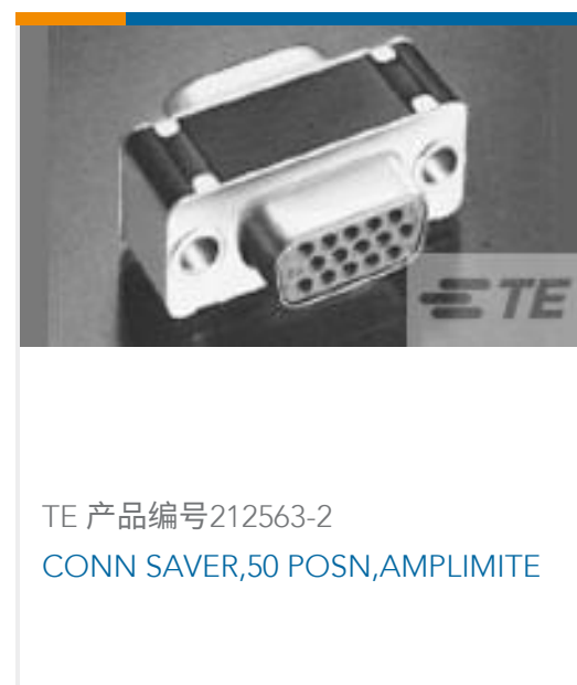
TE 产品编号212563-2 CONN SAVER,50 POSN,AMPLIMITE