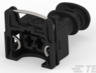
TE 产品编号2209441-1 2W SPLASH PROOF CONN. W.S.L. JPT