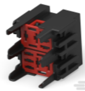
TE 产品编号2295763-1 MICRORELAY HOLDER ASSEMBLY