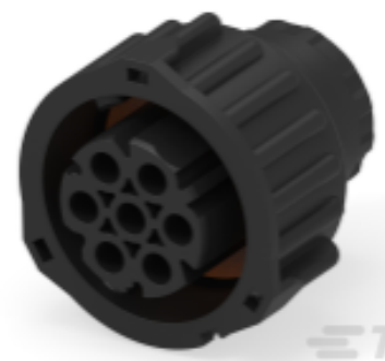
TE 产品编号1813344-1 7p 1.5mm socket housing assy' coding A