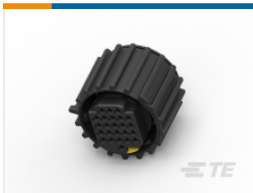
TE 产品编号1703399-1 24POS,AMP MCP1.5K,REC HSG,ASSY