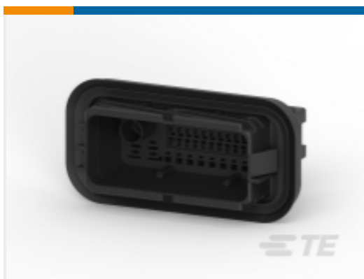
TE 产品编号2301239-1 DTB TAB HSG ASSY, 49POSN., FAKRA TYPE