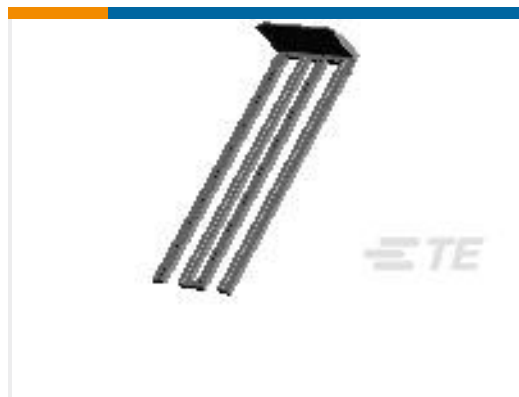
TE 产品编号1452997-1 76 POS 2-NDRAY LOCK BIG