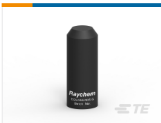
TE 产品编号135907N001 102L044-R05/S(S50)