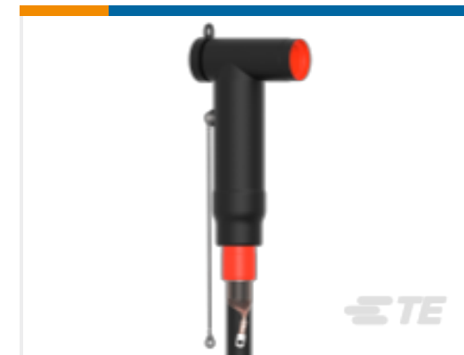
TE 产品编号CR6080-005 RSTI-5954