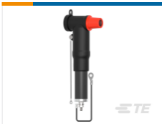
TE 产品编号CS3113-000 RSTI-CC-68SA1210