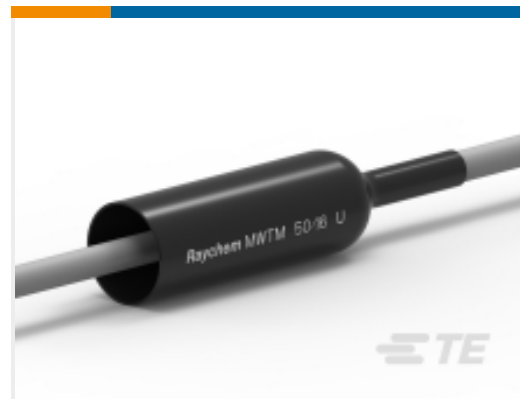
TE 产品编号115518-000 中厚壁热缩管