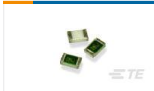
TE 产品编号1-1879213-2 CPF 0402 34R 0.1% 25PPM 1K RL