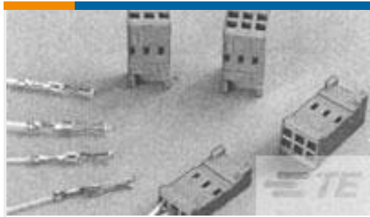
TE 产品编号281838-4 HOUSING HE13 HE14 COSI 4 P