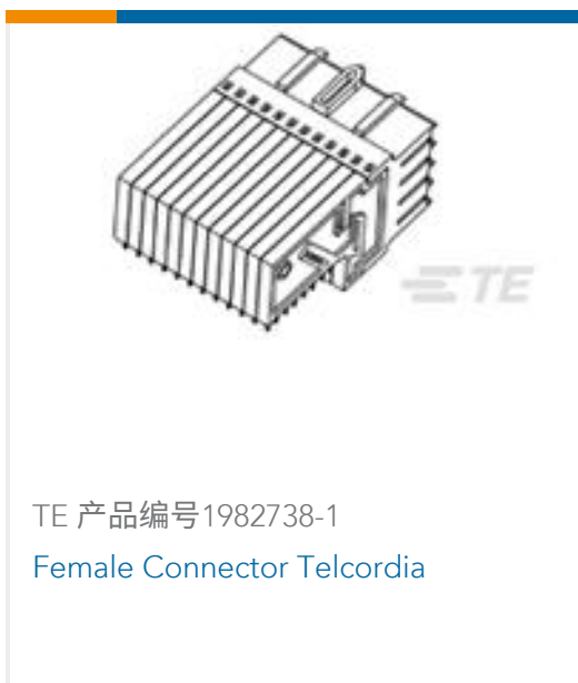
TE 产品编号1982738-1 Female Connector Telcordia