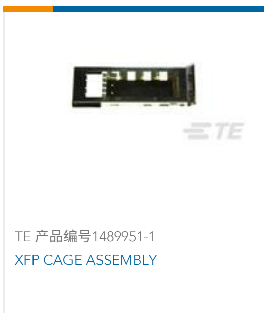
TE 产品编号1489951-1 XFP CAGE ASSEMBLY