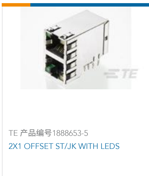
TE 产品编号1888653-5 2X1 OFFSET ST/JK WITH LEDS