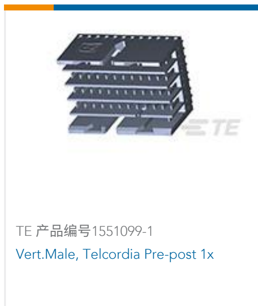
TE 产品编号1551099-1 Vert.Male, Telcordia Pre-post 1x