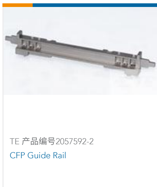
TE 产品编号2057592-2 CFP Guide Rail