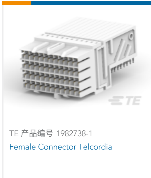
TE 产品编号 1982738-1 Female Connector Telcordia