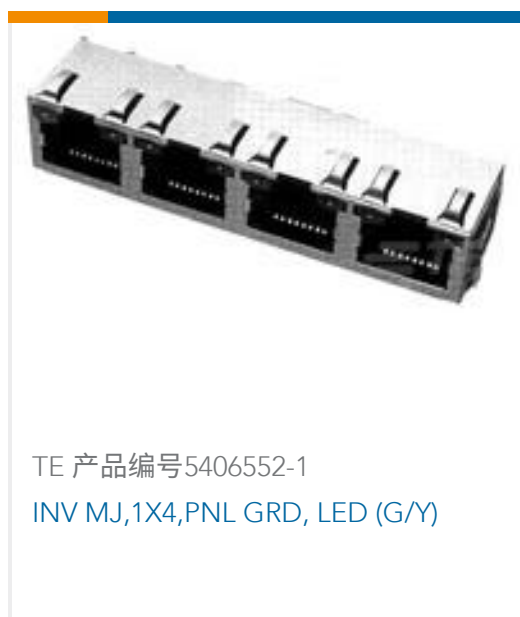
TE 产品编号5406552-1 INV MJ,1X4,PNL GRD, LED (G/Y)