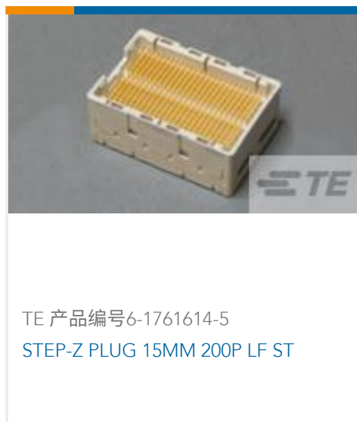
TE 产品编号6-1761614-5 STEP-Z PLUG 15MM 200P LF ST