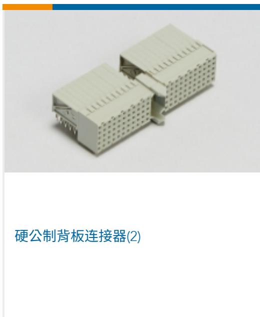
硬公制背板连接器(2)