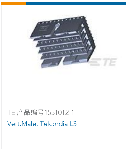
TE 产品编号1551012-1 Vert.Male, Telcordia L3