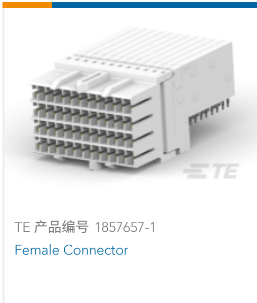
TE 产品编号 1857657-1 Female Connector