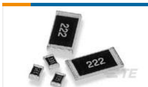
TE 产品编号3-2176067-2 CRG0201 1% 44R2