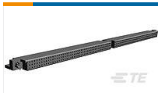
TE 产品编号5533514-6 ASSY,RECPT,R.ANGLE,HDI,LEAD-FR