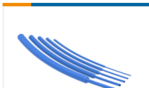
TE 产品编号NB23804001 VERSAFIT-3/8-6-SP