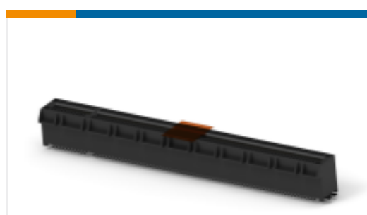
TE 产品编号 5-2337939-4 PCIE GEN4 CON,SMT,164POS,30u", MYLAR,HT