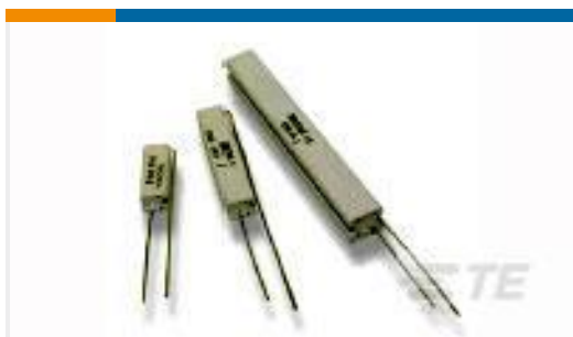
TE 产品编号1-1623726-0 SBCH 6 1R0 5%