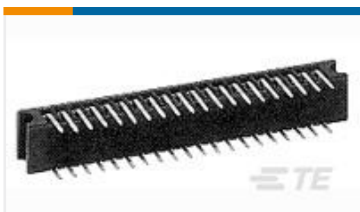
TE 产品编号7-532956-0 130 MODII 2PC CE RCPT ASSY, RoHS