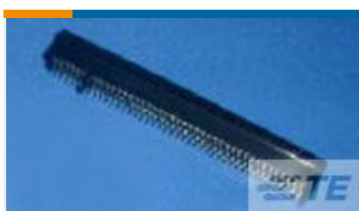
TE 产品编号 1734774-1 PCI EXP 3.1L 36 POS WHT G/F