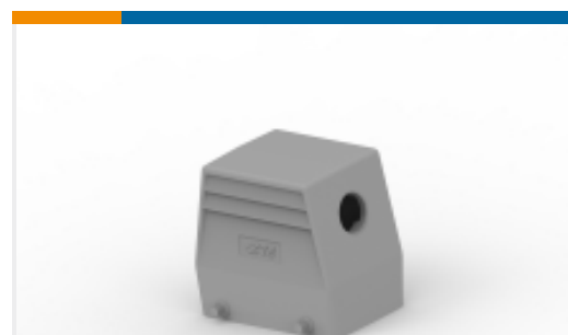
TE 产品编号T1319320120-000 H32A-TS-M20