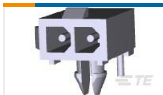
TE 产品编号1-770966-0 02P MINI UMNL R/A HDR ASSY SN