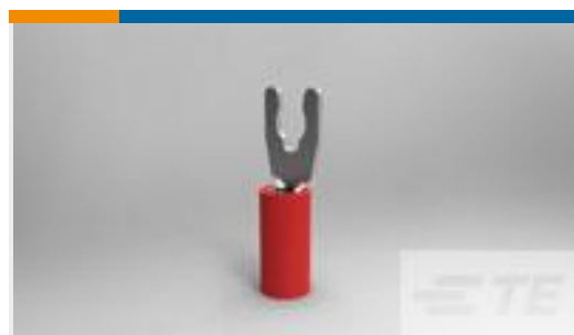
TE 产品编号52929-3 PIDG SP SPD 22-16COMM22-18MIL6