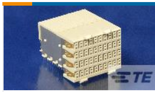
TE 产品编号6469001-1 HM-ZD 4PR RECP 80P