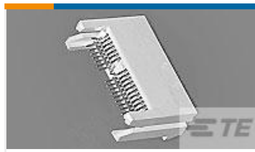
TE 产品编号3-1734857-4 PCI EXP STRADDLE 98P WHT 15u"