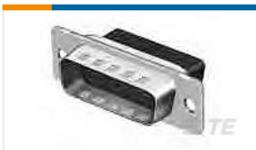
TE 产品编号205206-3 CRIMP SNAP PLUG ASSY,SIZE 2