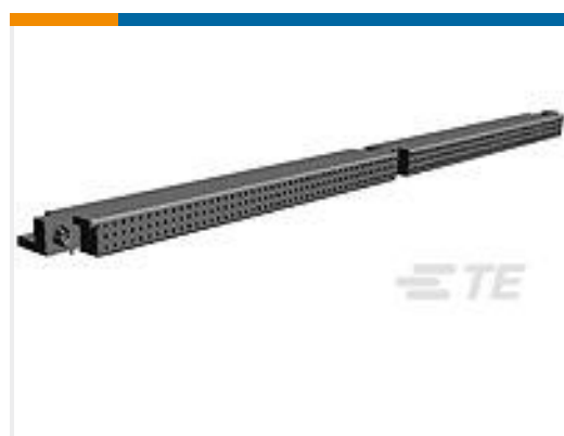
TE 产品编号5533514-6 ASSY,RECPT,R.ANGLE,HDI,LEAD-FR