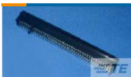
TE 产品编号 1734774-1 PCI EXP 3.1L 36 POS WHT G/F