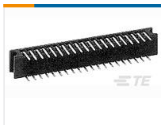
TE 产品编号7-532956-0 130 MODII 2PC CE RCPT ASSY, RoHS