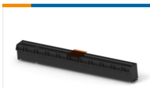
TE 产品编号 5-2337939-4 PCIE GEN4 CON,SMT,164POS,30u", MYLAR,HT