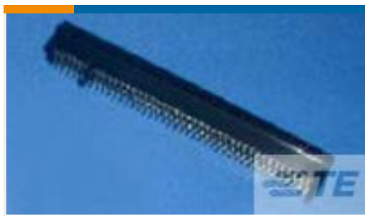
TE 产品编号 1734774-1 PCI EXP 3.1L 36 POS WHT G/F