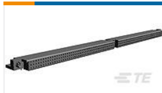
TE 产品编号5533514-6 ASSY,RECPT,R.ANGLE,HDI,LEAD-FR