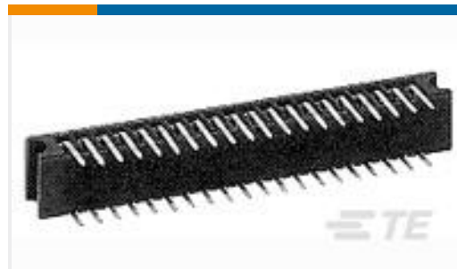
TE 产品编号7-532956-0 130 MODII 2PC CE RCPT ASSY, RoHS