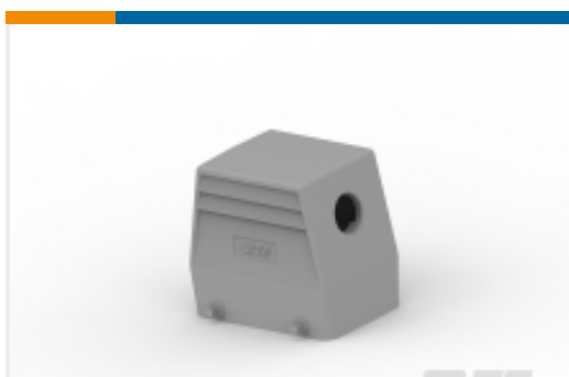
TE 产品编号T1319320120-000 H32A-TS-M20