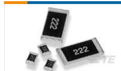
TE 产品编号3-2176067-2 CRG0201 1% 44R2