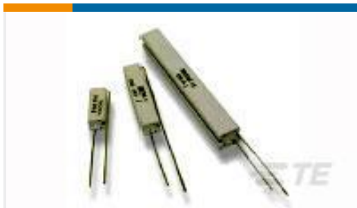
TE 产品编号1-1623726-0 SBCH 6 1R0 5%