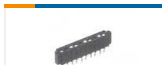
TE 产品编号5-520315-3 TRIOMATE ASSY V 3P L=3.556LDFR