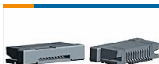
TE 产品编号2-1734592-9 FPC CONN. 0.5MM PITCH B/C, 29P