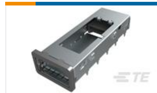
TE 产品编号1551891-1 Cage Assy, Behind Bezel, QSFP28