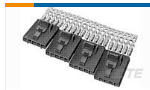
TE 产品编号5-103957-6 2X7 MTE RCPT SR LATCH .100CL