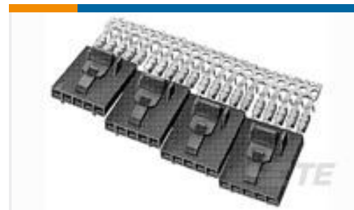
TE 产品编号5-103957-4 4X5 MTE RCPT SR LATCH .100CL