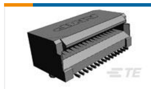
TE 产品编号1367500-1 30 POSN XFP CONN, ENHANCED