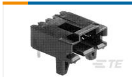
TE 产品编号5-103904-4 5 MTE HDR SRRA LATCH W/HLDWN