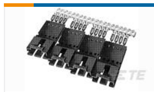
TE 产品编号5-103945-3 4X4 MTE SHRD PIN SR LATCH .100