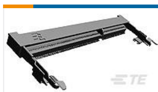
TE 产品编号2-2013297-3 EMBOSS TAPE DDR3 204P 8H STD Au 0.76