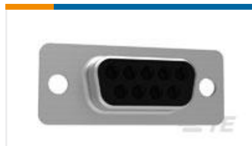
TE 产品编号5-747905-2 9 Rcpt Solder Cup, Gold Flash,