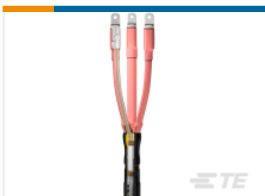
TE 产品编号C47372-064 GUST-12/25-50/800