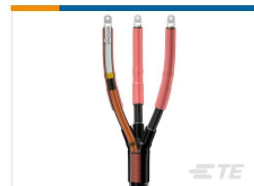
TE 产品编号E92435-063 POLT-12D/3XIH1