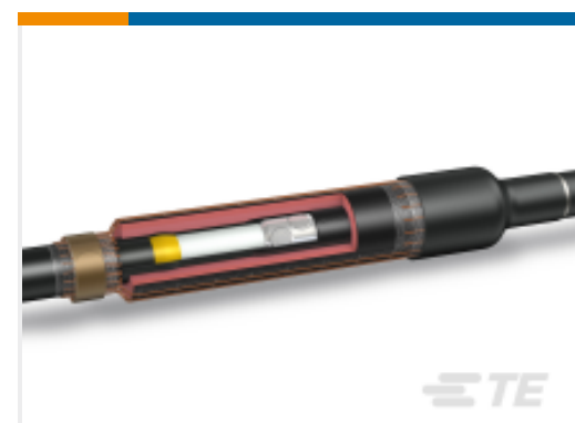
TE 产品编号E67139-069 POLJ-24/1X120-240