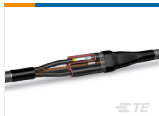
TE 产品编号D11309-070 POLJ-12/3X25-70