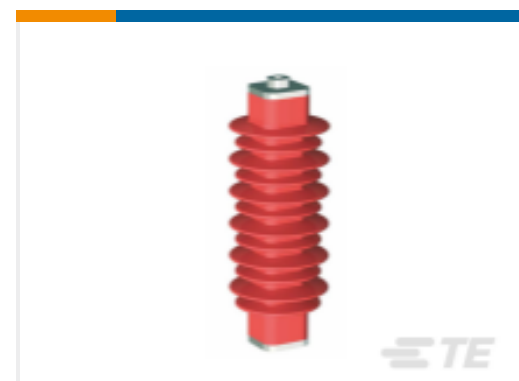
TE 产品编号EN6028-000 HDA-33M-B3-NFF