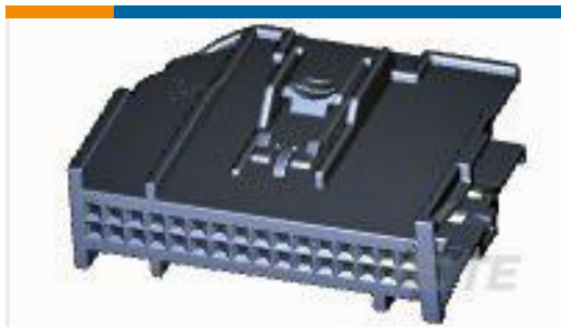
TE 产品编号2098660-1 32P Shield, GY HandMate