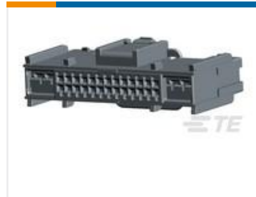
TE 产品编号1924900-1 Assy, Plug, 30p Hybrid Key A