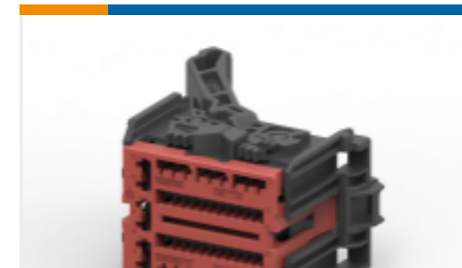
TE 产品编号1-2287336-1 72POS, MIXED, REC HSG, ASSY