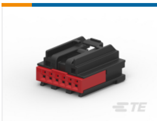
TE 产品编号2035363-7 1X6 GENERATION Y ASSY KEY E