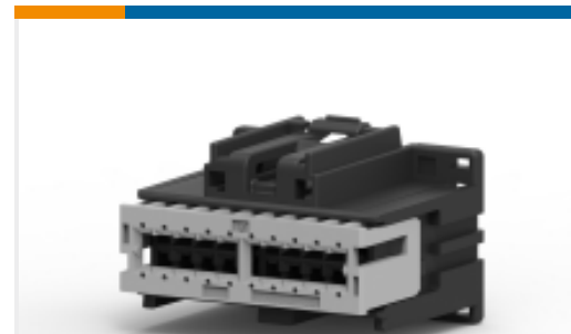
TE 产品编号2288276-1 Assy, Plug, USCAR, GenY, 20p, Key A, No CPA