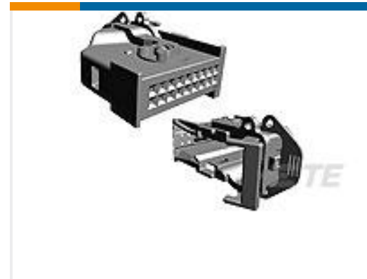
TE 产品编号1326132-1 18WAY LAC SHIELD ASSEMBLY 70 D