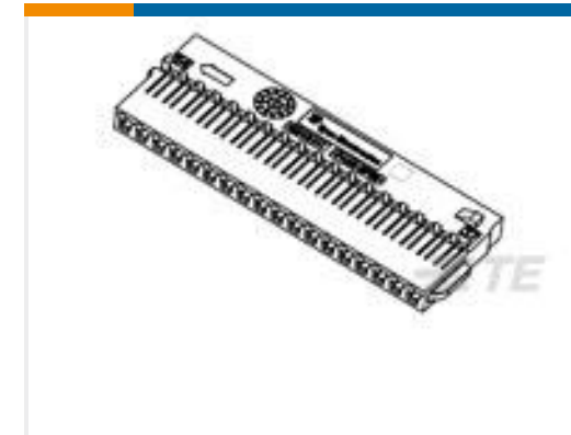
TE 产品编号1924341-1 18P, 1 Row Carrier for 54P LAC