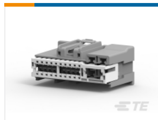
TE 产品编号2288274-2 24P HYBRID 0.64/2.8 PLUG ASSY, B KEY