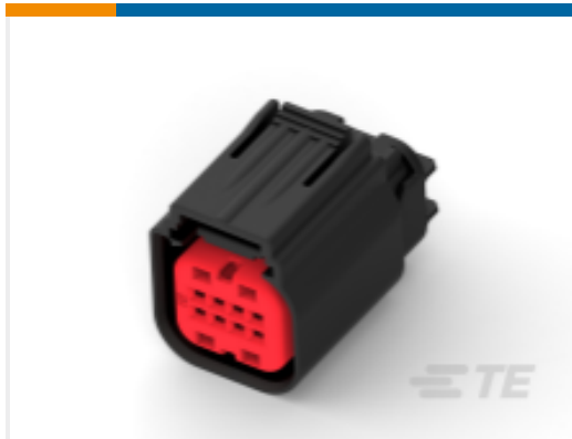
TE 产品编号1411001-9 2x4 SEALED HARN ASSY W/O CPA