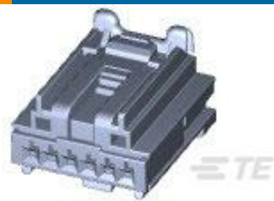
TE 产品编号 2035363-3 1X6 GENERATION Y ASSY KEY C