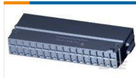
TE 产品编号2098216-1 32P Carrier, GY