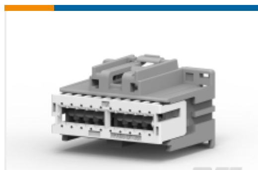
TE 产品编号2288276-2 ASSY,PLUG,USCAR,GENY,20P,KEY B, NO CPA