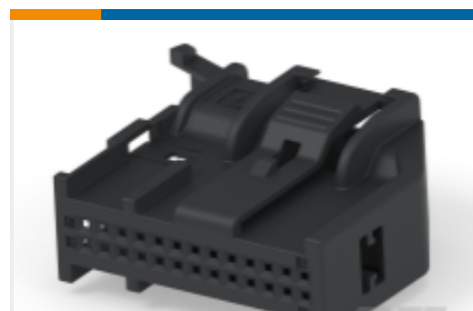
TE 产品编号2378797-1 Shield, 26P GenY, Hand Mate Conn