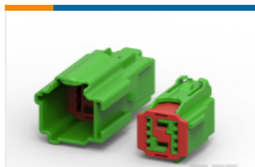
TE 产品编号2098407-1 GET .64 连接器系统, 连接器壳体