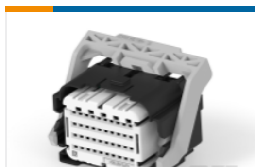
TE 产品编号5-1924513-6 GET 40 WAY HARNESS ASSY, KEY J