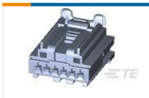
TE 产品编号2035363-5 1X6 GENERATION Y ASSY KEY D