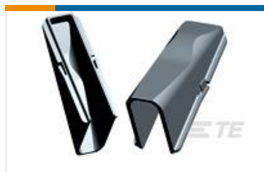
TE 产品编号1544552-1 CAPOT PC 5V