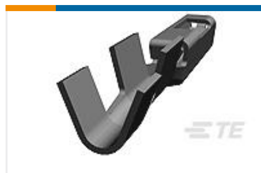
TE 产品编号638551-4 CONTACT,FEMALE,0.64MM,SN,22