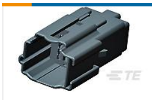
TE 产品编号2141995-1 10POS,TAB 0.63X0.64,PIN HSG,ASSY