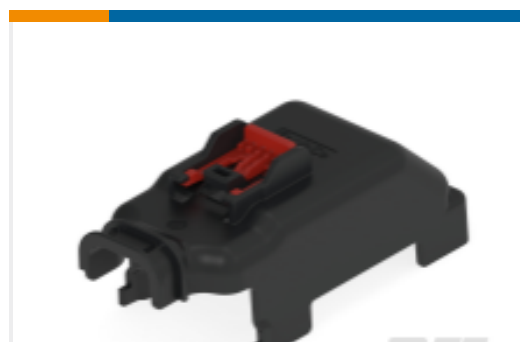
TE 产品编号2324930-1 REC CONN CVR ASSY,40POS,HYBRID