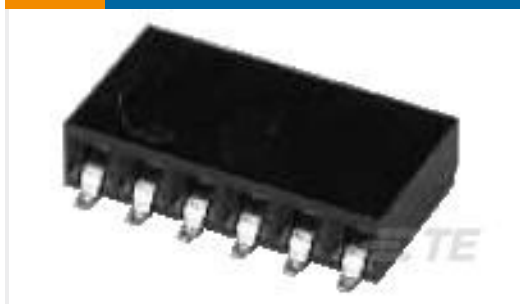
TE 产品编号5147733-3 04 MODII HORZ SR SFMNT SN