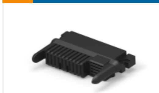
TE 产品编号8-1926739-3 ASSYMINIPAK HDL25S10PRARECPTSC