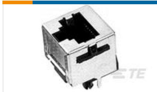
TE 产品编号2-1734858-3 RJ11,8P8C, TOP ENTRY, SMT, 30u"