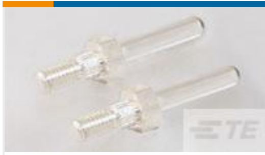
TE 产品编号1766663-6 ICCON PIN, 20MM, M3.5 EXT THREAD