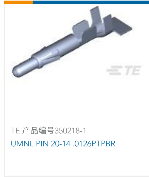
TE 产品编号350218-1 UMNL PIN 20-14 .0126PTPBR