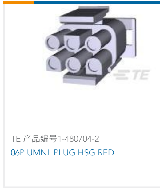
TE 产品编号1-480704-2 06P UMNL PLUG HSG RED