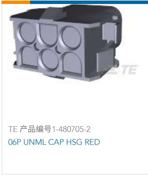
TE 产品编号1-480705-2 06P UNML CAP HSG RED