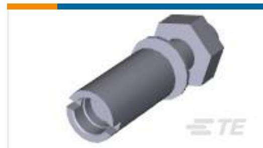
TE 产品编号201047-2 SERIES "M" ST. STL. GUIDE SOC.