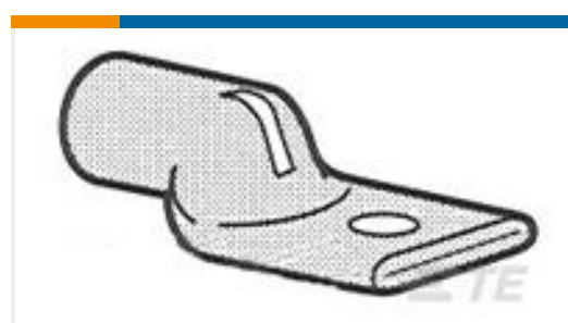
TE 产品编号325502 TERMINAL, AMPPOWER 3/0 5/16