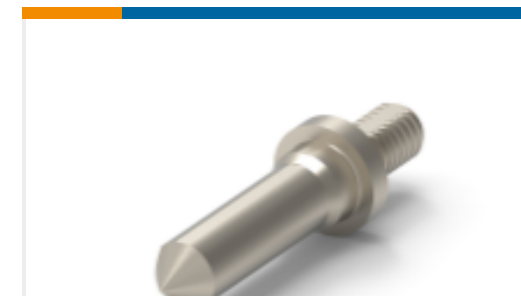
TE 产品编号1410337-1 MULTIGIG RT GUIDE PIN, 9MM 2.60