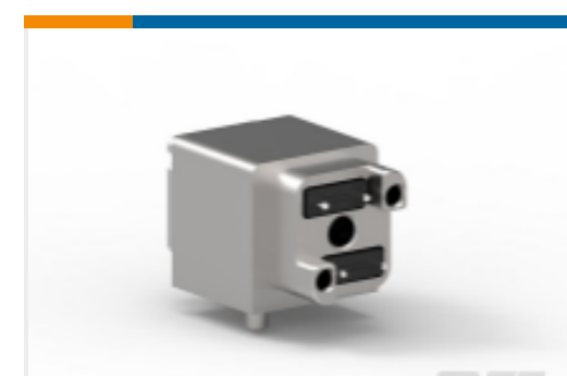
TE 产品编号2828384-2 CONN KIT, VITA66.4-DERIV, PLUG, DUAL-CAVITY