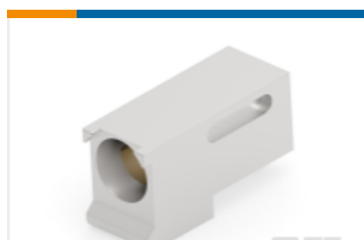
TE 产品编号2000713-8 RA Keyed Guide Mod, Vita 46, Machined