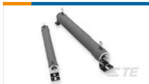
TE 产品编号2-1879447-7 TE 200W 150R 5% Bracket