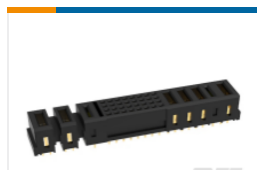
TE 产品编号2313441-1 MULTIBEAM, VERT ASSY, VITA 62.2, PRSSFIT