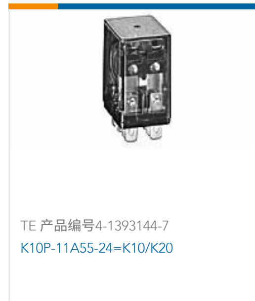
TE 产品编号4-1393144-7 K10P-11A55-24=K10/K20