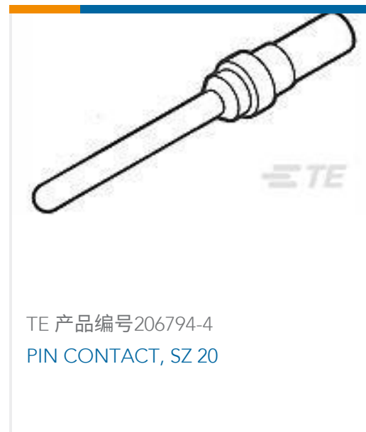
TE 产品编号206794-4 PIN CONTACT, SZ 20