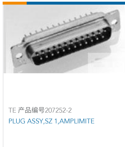
TE 产品编号207252-2 PLUG ASSY,SZ 1,AMPLIMITE