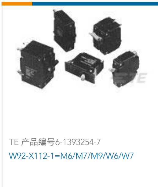
TE 产品编号6-1393254-7 W92-X112-1=M6/M7/M9/W6/W7