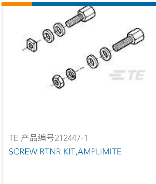
TE 产品编号212447-1 SCREW RTNR KIT,AMPLIMITE