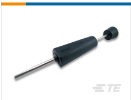
TE 产品编号 305183 EXTRACT TOOL TYPE 2 20-16