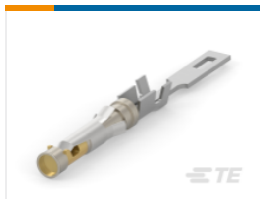
TE 产品编号 202237-7 III+SOC,SOLTAB,30AU>10,LP,SN