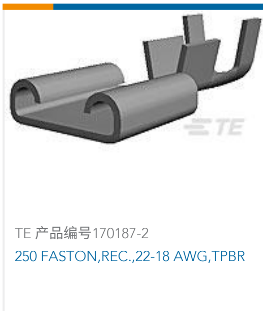
TE 产品编号170187-2 250 FASTON,REC.,22-18 AWG,TPBR