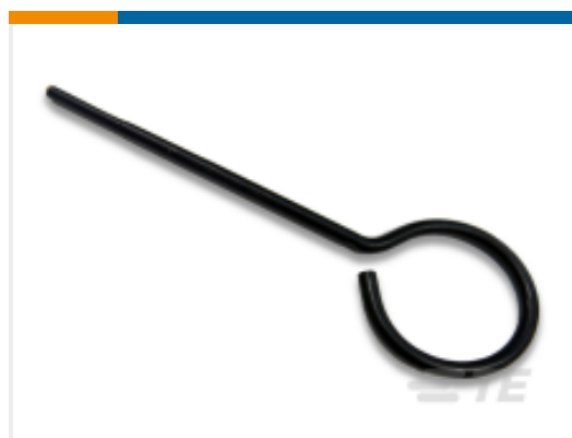
TE 产品编号 200893-2 INSERTION TOOL CONT