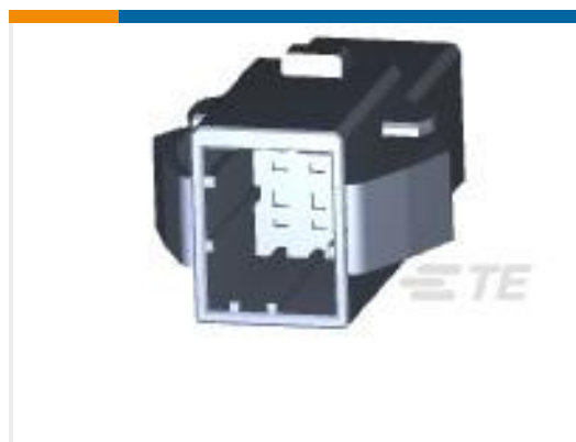
TE 产品编号2-1318114-3 DYNAMIC D2100 TAB HSG 6P P/M Y