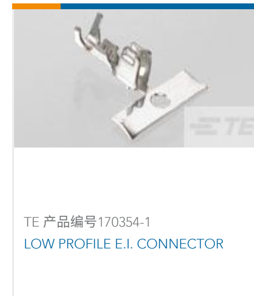
TE 产品编号170354-1 LOW PROFILE E.I. CONNECTOR