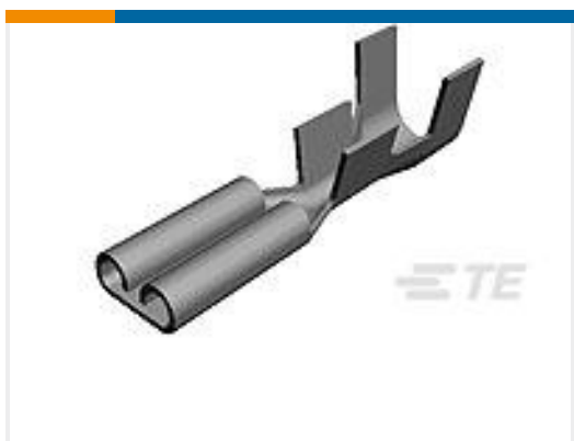
TE 产品编号41729 250 FASTON REC 18-16 AWG TPBR