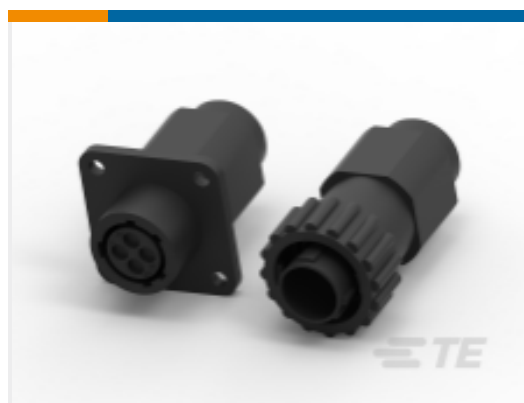
TE 产品编号 CAT-AM71-C83998Y One-Piece Connector, Sealed, CPC Series 1