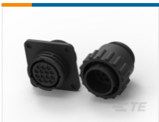
TE 产品编号 CAT-AM71-C83998K Circular Connector, Environmentally Sealed, CPC Series 6