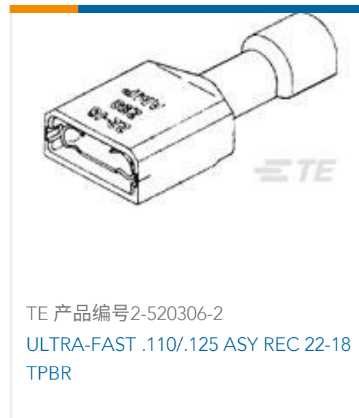
TE 产品编号2-520306-2 ULTRA-FAST .110/.125 ASY REC 22-18 TPBR