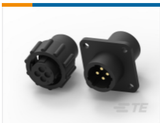
TE 产品编号 CAT-AM71-C83998J Cable/Panel Mount Connector, CPC Series 1