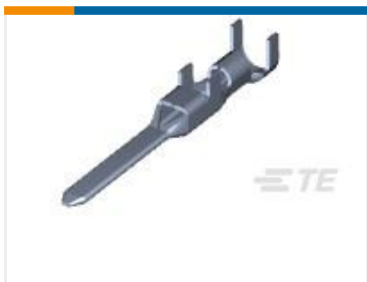
TE 产品编号175289-5 DYNAMIC D-3 TAB CONT. L PRE-TIN L/P