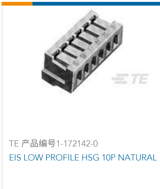
TE 产品编号1-172142-0 EIS LOW PROFILE HSG 10P NATURAL