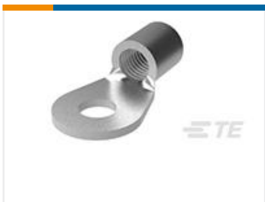
TE 产品编号320744 TERMINAL, SOLIS R 1/0 5/8