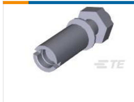
TE 产品编号201047-2 SERIES "M" ST. STL. GUIDE SOC.