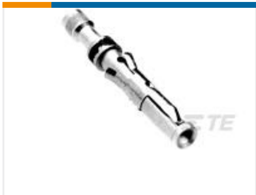
TE 产品编号200333-1 CONTACT SOC. ASSY.