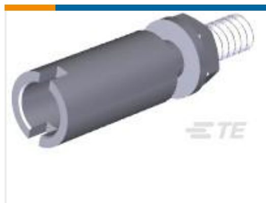
TE 产品编号1-200835-1 SERIES "M" MIN. RECT. GUIDE SOC