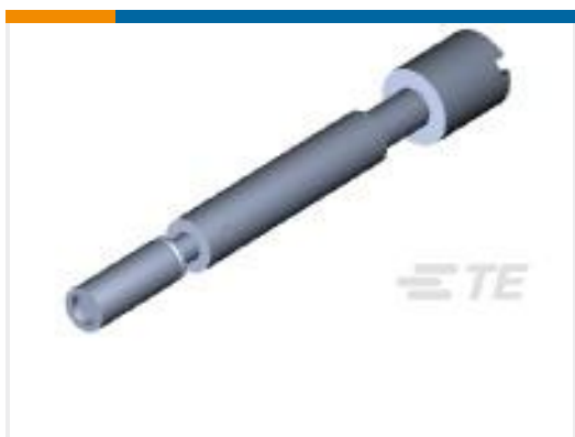
TE 产品编号200867-1 SERIES "M" JACKSCREW FEM. ASSY