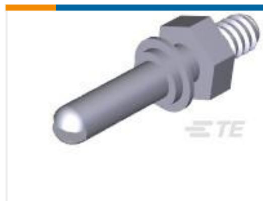
TE 产品编号1-201046-2 SERIES "M" MIN RECT GUIDE PIN