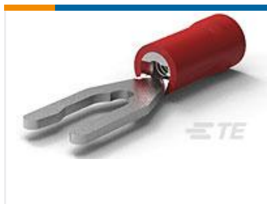
TE 产品编号52453-1 PG SPR SPD 22-16COMM22-18MIL 6