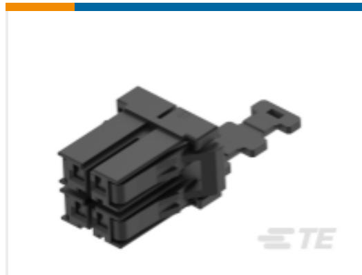
TE 产品编号1-2303376-1 D3200 FMLB REC STRAIN RELIEF KIT 4P RR