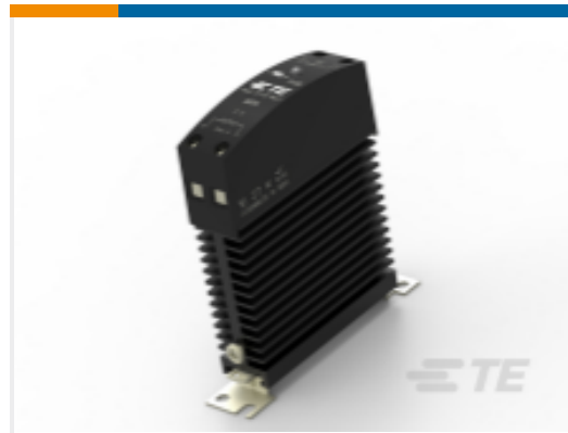
TE 产品编号9-1393030-3 SSRK-240A20 = DIN Rail MOUNT, 20A, 240V AC