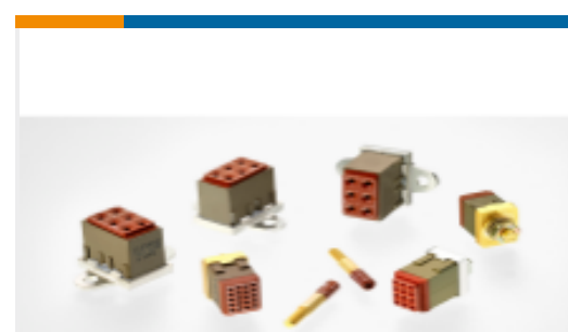
TE 产品编号CTJ720E01B-7067 MODULE ASSY