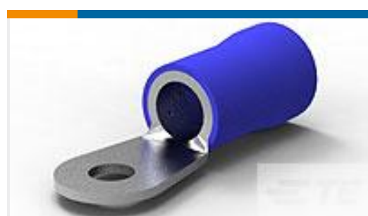
TE 产品编号52045-1 TERMINAL R PG 1/0 5/16