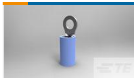
TE 产品编号36158 TERMINAL,PIDG R 16-14 6