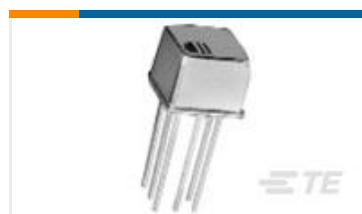
TE 产品编号2-1617146-7 JMGACDD-26L = M39016/19-036L