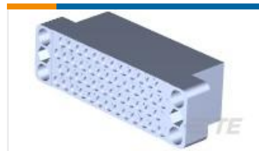
TE 产品编号200277-2 FEMALE BLOCK 50 PL