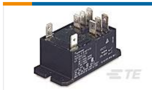
TE 产品编号1-1393212-7 T92S7D22-24