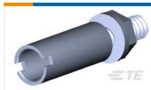
TE 产品编号200390-9 SERIES "M" GUIDE SOCKET