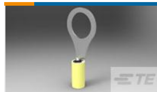
TE 产品编号2-320576-1 TERMINAL,PIDG R 12-10 5/16