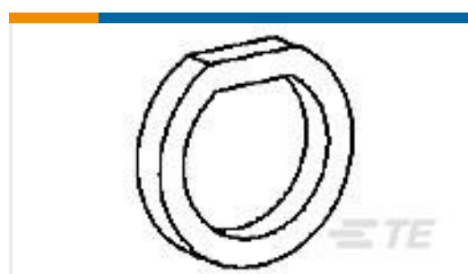
TE 产品编号1445420-2 SEAL,FLANGE,SIZE 11