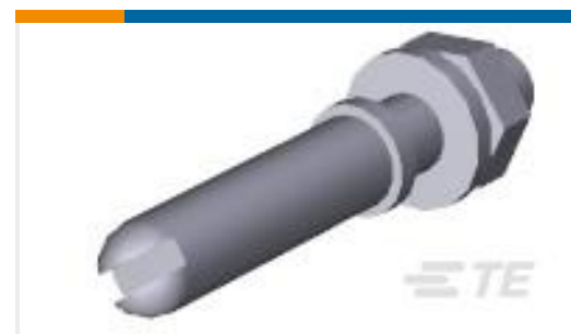
TE 产品编号200389-2 GUIDE PIN KIT