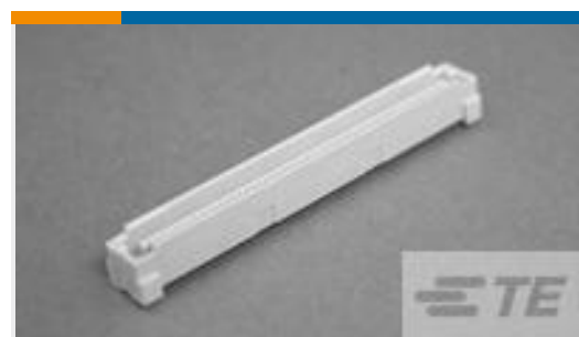
TE 产品编号1-5177986-3 0.8FH,P06H.5,080,08/Sn,TR,SC