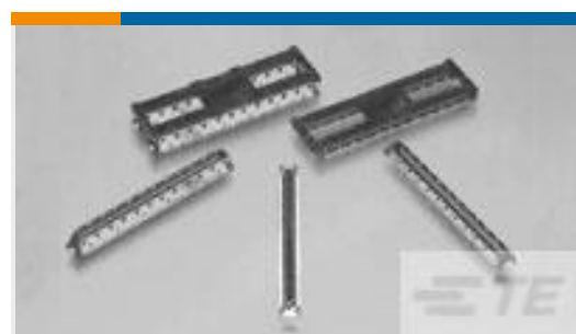
TE 产品编号3-1827233-6 .5FHP05H,440,B,GIG,08/Sn,HT,NS