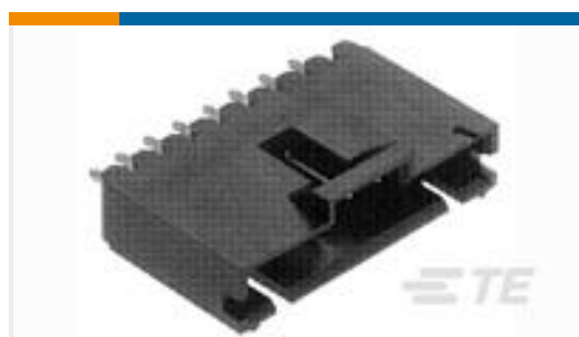
TE 产品编号5-103735-2 03 MTE HDR SRST LATCH .100CL