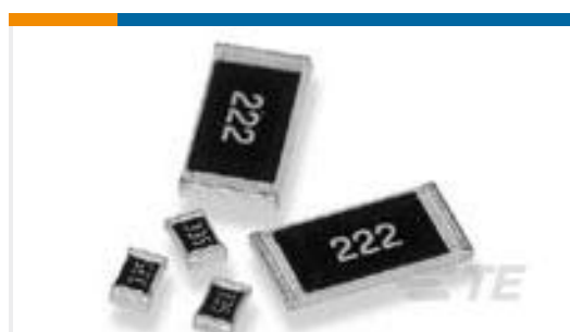
TE 产品编号4-1879501-3 CRGH2512 5% 56R 2W