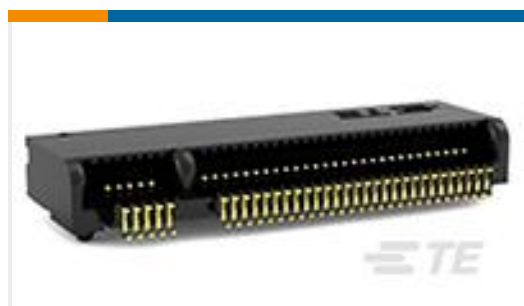
TE 产品编号1-2199119-6 M.2 0.5PITCH 3.2H KEY M 30U" AU