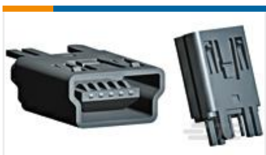
TE 产品编号1734753-1 MINI USB, TYPE B, VERTICAL, T/H