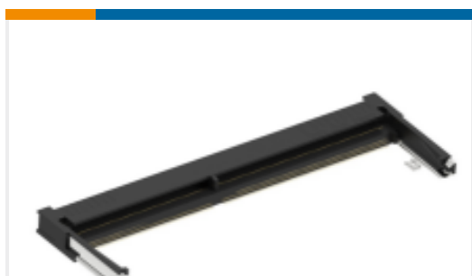
TE 产品编号2309410-3 DDR4 SODIMM 260P 5.2H RVS