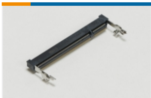
SO DIMM 插槽(13)