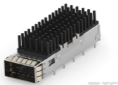
TE 产品编号1-2170704-0 CAGE ASSY, QSFP28 1X1, SPRING, HS