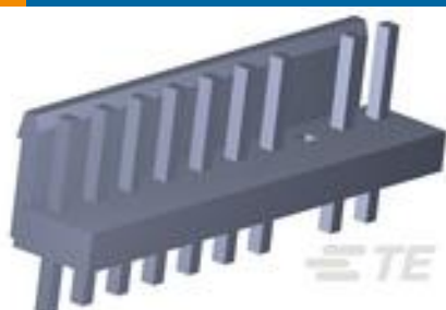
TE 产品编号1-1744524-0 EP 10P HEADER ASY NO 8 PIN