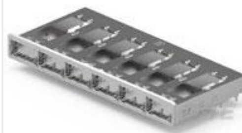
TE 产品编号2143329-1 1x6 QSFP Cage Assy Behind Bzl