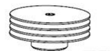
TE 产品编号1-1542006-0 HTS210-U=HS 25MM ASSY ULTEM CL