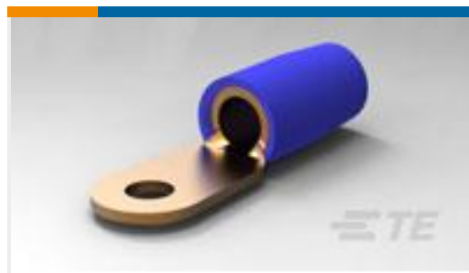
TE 产品编号324046 TERMINAL,T-N R 6 10