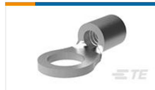
TE 产品编号322927 SOLIS R 22-16 COMM 22-18 MIL 2