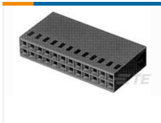
TE 产品编号2-86177-1 50 MODIV HSG COMP DR .100CL