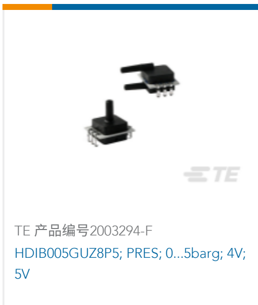
TE 产品编号2003294-F HDIB005GUZ8P5; PRES; 0...5barg; 4V; 5V