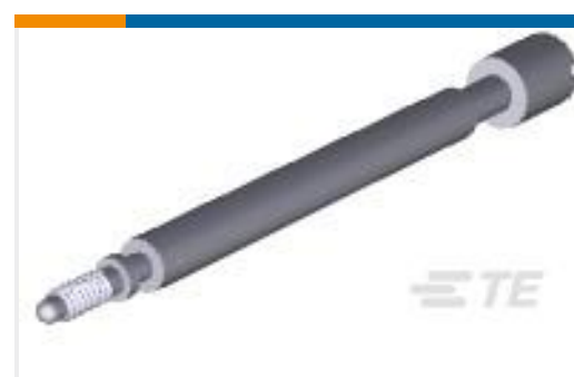
TE 产品编号207234-1 UNASSM JS KIT,M SERIES