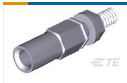
TE 产品编号200875-7 SKT ASSY,M SERIES