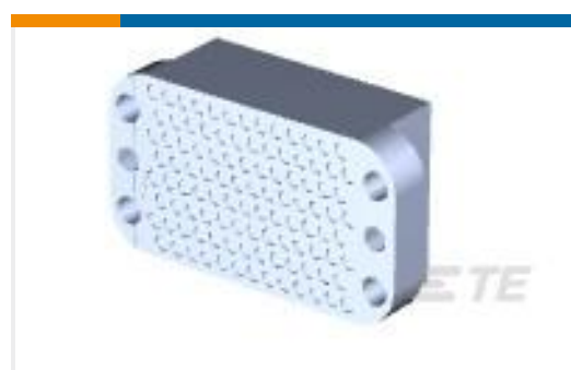
TE 产品编号201345-1 104 PL. MALE BLOCK-PHEN.