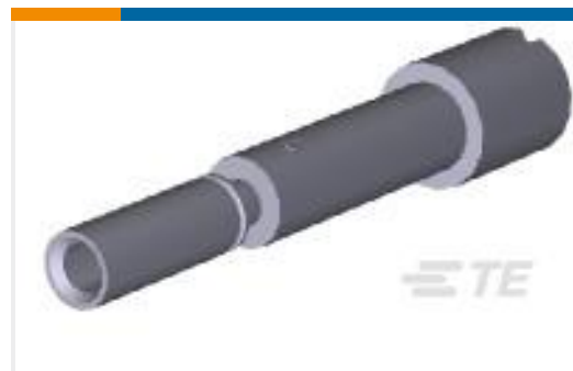
TE 产品编号200870-1 SERIES "M" JACKSCREW FEMALE ASS