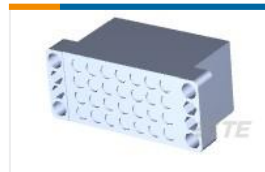
TE 产品编号205689-2 PIN BLOCK 28 POS. SPL.