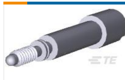
TE 产品编号200868-1 SER. "M" JACKSCREW MALE ASSEM.