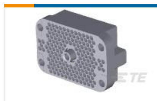
TE 产品编号202800-2 RECEPT ASSY,160 POS,M-SERIES