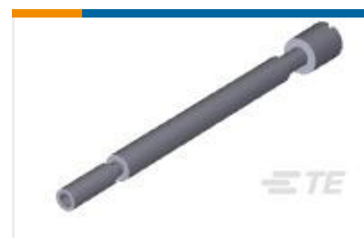
TE 产品编号207235-1 UNASSM JS KIT,M SERIES