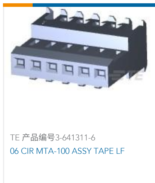
TE 产品编号3-641311-6 06 CIR MTA-100 ASSY TAPE LF