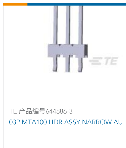
TE 产品编号644886-3 03P MTA100 HDR ASSY,NARROW AU