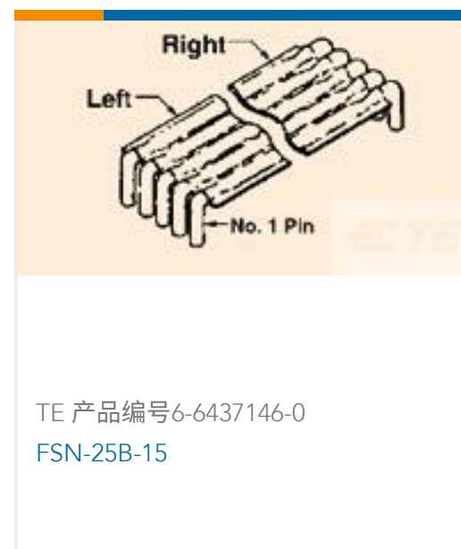
TE 产品编号6-6437146-0 FSN-25B-15