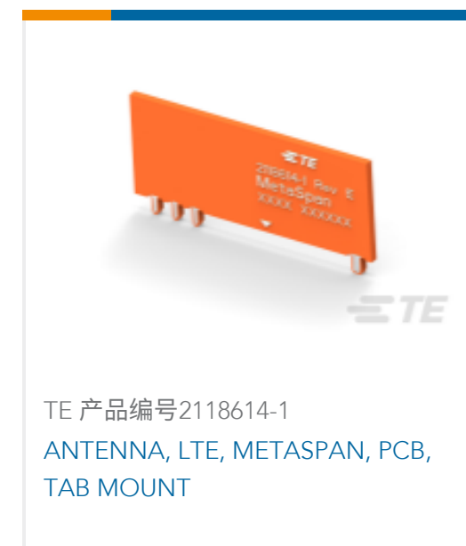
TE 产品编号2118614-1 ANTENNA, LTE, METASPAN, PCB, TAB MOUNT