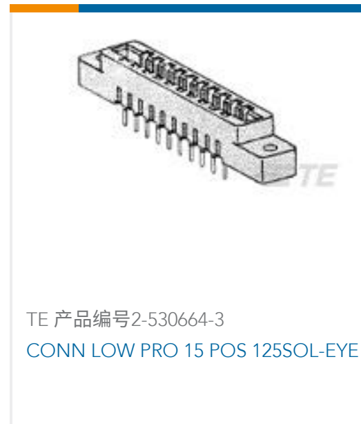
TE 产品编号2-530664-3 CONN LOW PRO 15 POS 125SOL-EYE