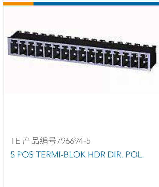
TE 产品编号796694-5 5 POS TERMI-BLOK HDR DIR. POL.