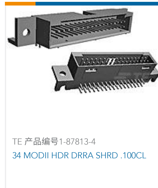
TE 产品编号1-87813-4 34 MODII HDR DRRR SHRD .100CL