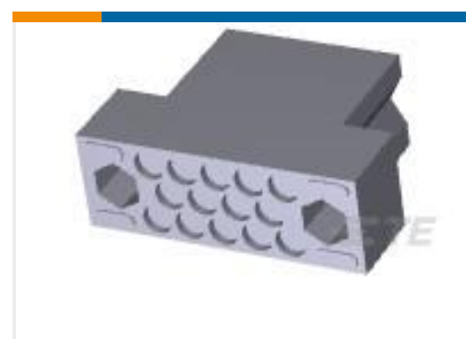
TE 产品编号201355-1 MALE BLOCK 14 PL.