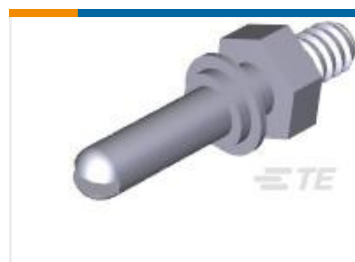
TE 产品编号1-201046-2 SERIES "M" MIN RECT GUIDE PIN