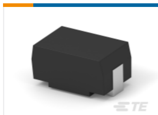
TE 产品编号5-1879234-7 SMD 功率电阻器：7 瓦特，200-2M 欧姆