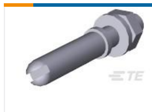
TE 产品编号200389-2 GUIDE PIN KIT