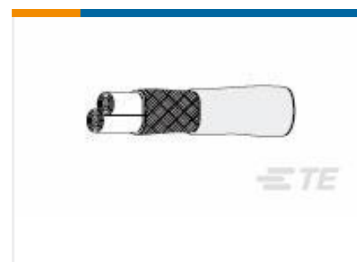
TE 产品编号306017-001 44AM1121-16-0/9-9