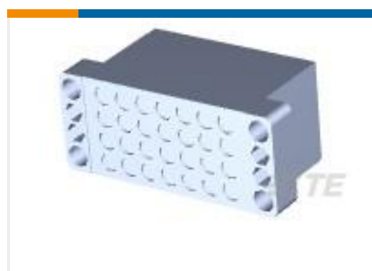
TE 产品编号205689-2 PIN BLOCK 28 POS. SPL.