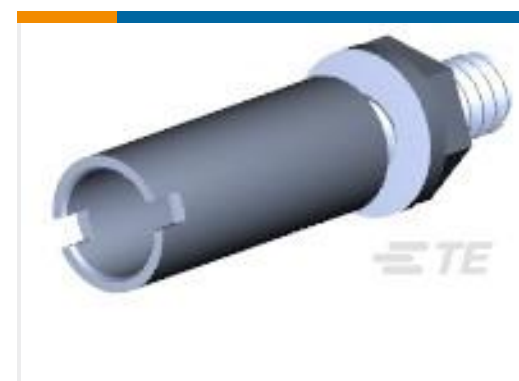
TE 产品编号200390-9 SERIES "M" GUIDE SOCKET