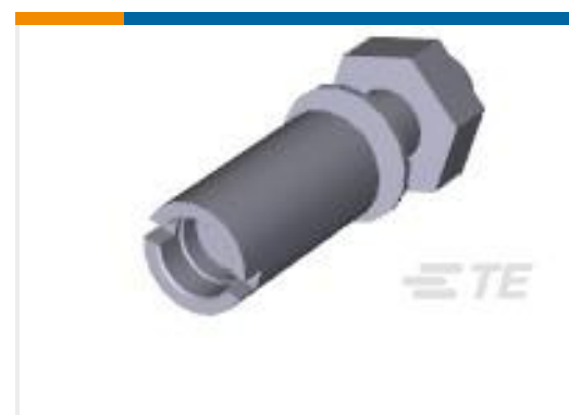
TE 产品编号201047-2 SERIES "M" ST. STL. GUIDE SOC.