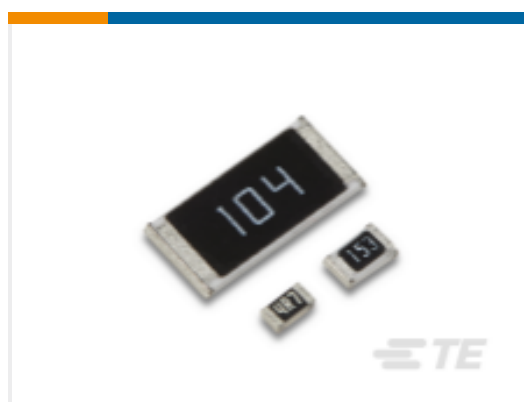
TE 产品编号1-2176343-6 CRGCQ 1206 180R 1%