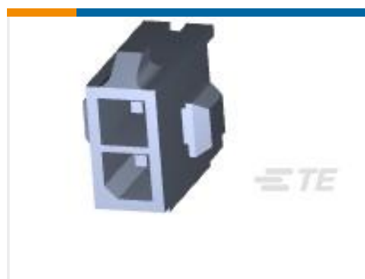
TE 产品编号3-794630-2 02P MICRO MNL ASSY,VRT,HDR,LF