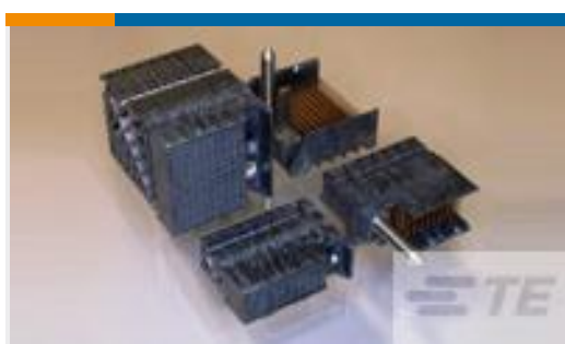
TE 产品编号 2007741-1 IMP100S,R,RA6P10C,UG,39