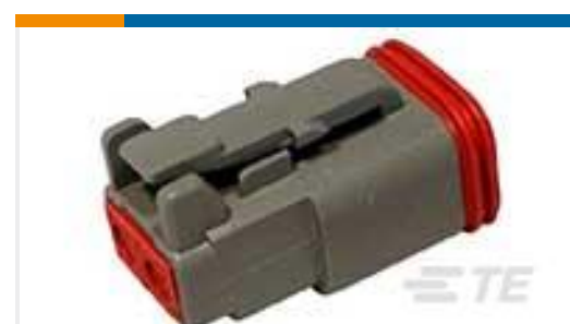
TE 产品编号DT06-2S PLG, 2P, GRY, N